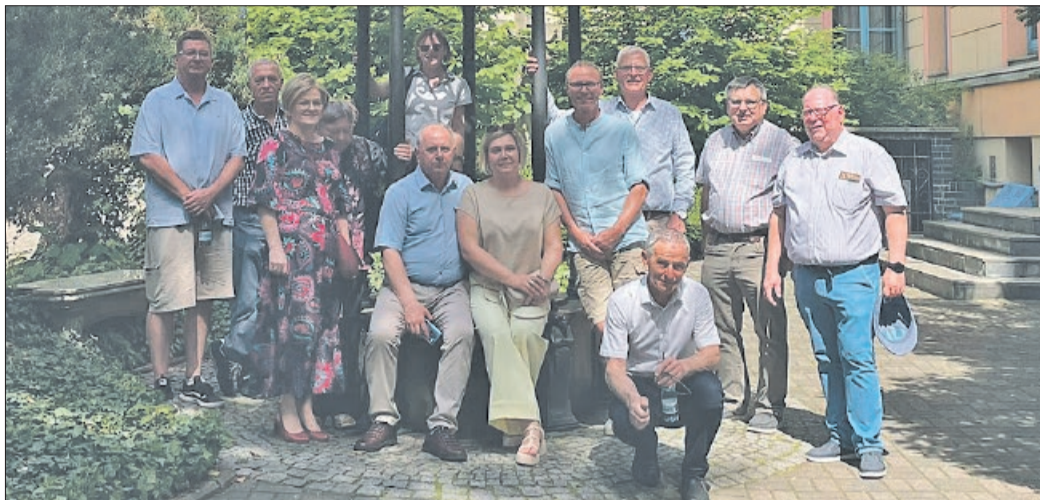
Polnische und deutsche Delegation mit dem Bürgermeister von Tulowice und seiner Frau in der Bildmitte

Um 15 Uhr begann mit den Grußworten vom Bürgermeister von Tulowice und mir als Vertreter für Gerd Albrecht die offizielle