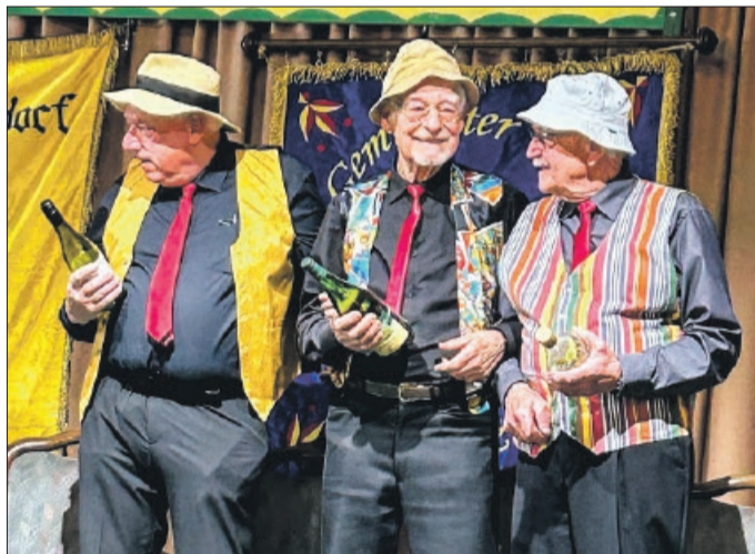
Die Männer belustigten mit der Weisheit ums Geld.