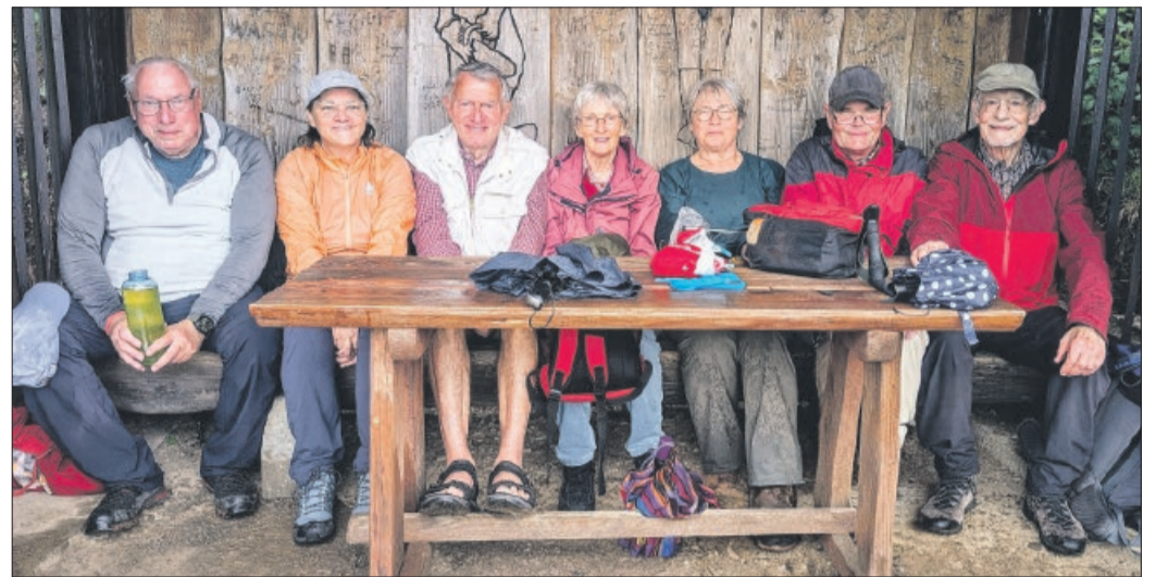
Wendeburger Wanderfreunde beim Eleonorenblick im Sösetal.

Am Auerhahnplatz stießen die Wendeburger auf den Reitsteg, der von Stieglitz zur Hanskühnenburg verläuft. Auf dem Acker, so wird der Höhenrücken genannt, ging es ein ganzes Stück eben bis zum Berghaus. 650 Höhenmeter waren geschafft, und in einer kuscheligen, überdachten Sitzgruppe wurde eine wohlverdiente Mittagspause einge-