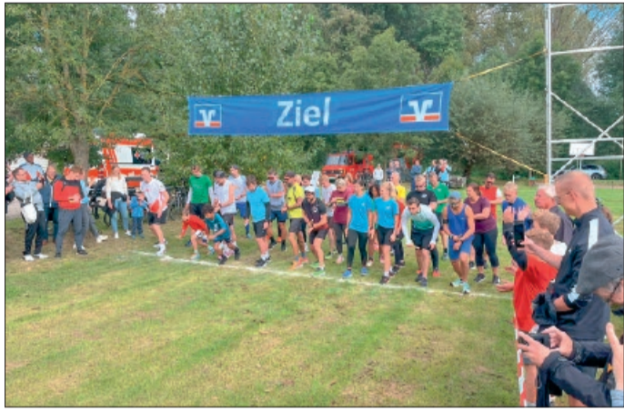
Start des letzten Laufs in Wierthe 2024.

Liedingen. Am Sonntag, 20. September , findet der 17. Vechelder Gemeinde-Staffellauf statt. Ziel der traditionsreichen Veranstaltung ist es, möglichst viele Bürgerinnen und Bürger zu gemeinschaftlicher Bewegung zu motivieren – im Vordergrund stehen dabei Spaß und Teamgeist.