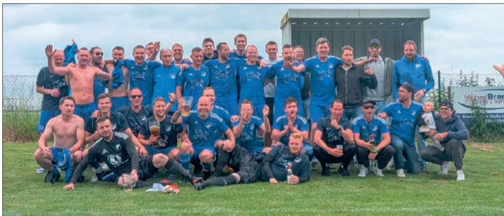
Erste Herrenmannschaft nach dem 12:1-Sieg.

Bodenstedt. Am 4. Juni, war es soweit und die Herrenmannschaft der SG Bodenstedt/Bettmar konnte den Aufstieg in die 1. Kreisklasse feiern.