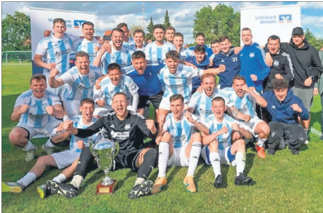
Der Kreispokal Sieger 2025/26 TSV Sonnenberg möchte auch den diesjährigen Gemeindepokal nach Sonnenberg holen.

Bei den Herren stehen folgende Vorrundenspiele auf dem Programm: SG Bodenstedt/Bettmar trifft am Do., 9.7., auf SG Wedtlenstedt/Bortfeld. Am Fr., 10.7., spielt Arminia Vechelde gegen GW Vallstedt. Am Mo., 13.7., kommt es zur Begegnung SG Bodenstedt/Bettmar gegen TSV Denstorf. Einen Tag später, am Di., 14.7., trifft TSV Sonnenberg auf Arminia Vechelde. Am Do., 16.7., spielt SG Wedtlenstedt/