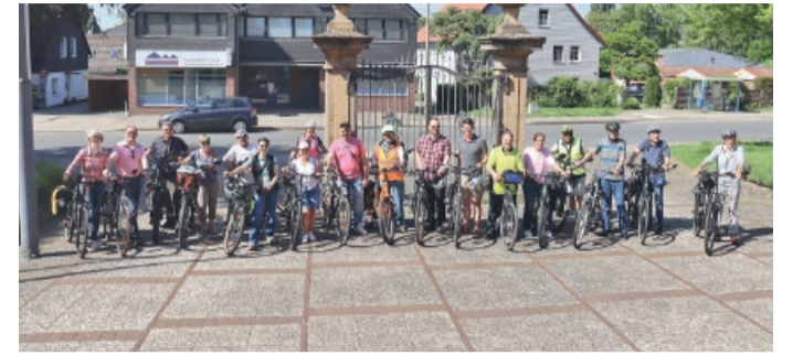
Gruppenbild vor dem Vechelder Bürgerzentrum.

Die ursprünglich als Auftaktveranstaltung geplante Stadtradel-Tour durch die Gemeinde Vechelde wurde u. a. witterungsbedingt vom 7. Mai auf den 22. Mai 2026 verschoben. Aber, das Warten auf den Ersatztermin hat sich gelohnt: die Radtour am vergangenen Freitag, den 22. Mai 2026, durch die Gemeinde Vechelde war für alle Beteiligten, insbesondere aufgrund der sommerhaften Temperaturen, ein gelungenes und schönes Erlebnis.