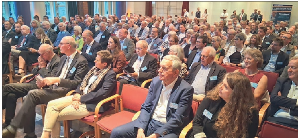
200 geladene Gäste haben im vollbesetzten Forum an der Jubiläumsfeier zu 80 Jahre CDU im Kreis Peine teilgenommen.