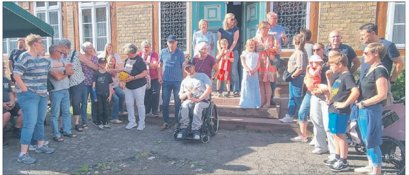
Die Top-Platzierten der Bodenstedt-Rallye. Auf der Treppe oben die Sieger-Gruppe „Die flotten Flitzer“.

Bodenstedt. Eine Dorfrallye in Bodenstedt. So etwas hat es seit etwa 20 Jahren nicht mehr gegeben.