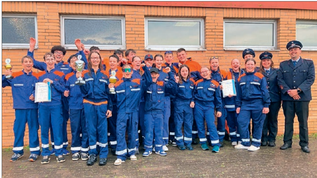
Die Gruppen aus Vechelde/Wahle (1. und 3. Platz)

Wahle blau überzeugte insbesondere durch eine nahezu fehlerfreie Leistung: Im sogenannten B-Teil erreichte sie eine Zeit von 1:47 Minuten ohne Fehlerpunkte. Auch beim Knotenteil zeigte die Gruppe mit 8 Sekunden eine herausragende Schnelligkeit. Mit insgesamt