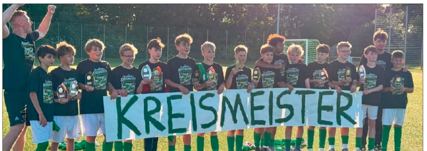
Eine fantastische Leistung – Ihr könnt stolz auf Euch sein. Macht weiter so und behaltet Euren Teamgeist, Euren Einsatz und Eure Freude am Fußball bei. Ein großer Dank gilt auch Euren Trainern, die Euch mit viel Engagement begleitet und unterstützt haben, sowie allen Eltern, Betreuern und Unterstützern, die ihren Beitrag zu diesem Erfolg geleistet haben. Genießt Euren Titel – Ihr habt ihn Euch verdient! Text: Torsten Langer, Foto: SV Arminia Vechelde