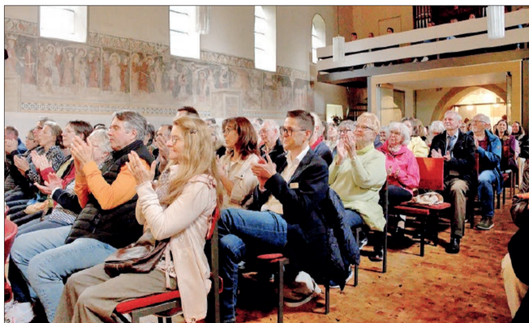
Das Publikum sparte nicht mit Beifall und belohnte die Musiker nach über zwei Stunden Konzertprogramm und mehreren Zugaben begeistert mit Standing Ovations.