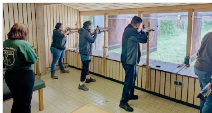
Schützen während des Wettbewerbes