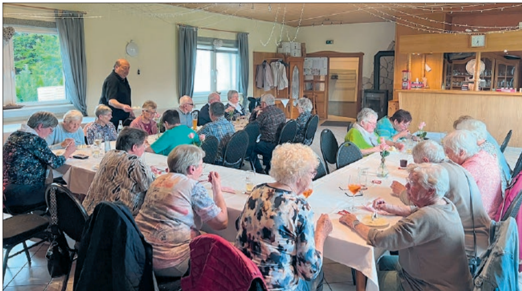
Großer Andrang und hervorragende Stimmung: Der AWO-Ortsverein Heere lud zum gemeinsamen Spargelessen in das Restaurant Roma ein.

Ergänzt wurde das Büfett durch eine vielfältige Auswahl an Beilagen wie Kartoffeln und Kroketten sowie herzhaften Komponenten wie Schnitzeln, Schinken, geräuchertem Lachs