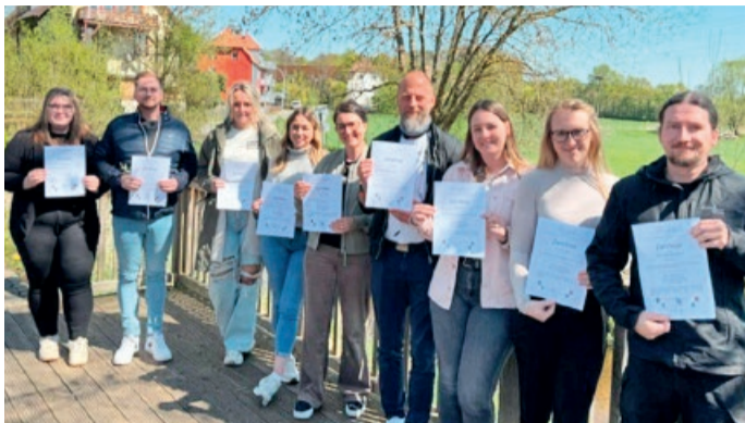
Erfolgreiche Teilnehmerinnen und Teilnehmer im ersten Durchgang

Zwischen November und Mai haben 12 Kita-Leitungen und Stellvertretungen aus den Kommunen Cremlingen, Schladen-Werla, Oderwald und der Samtgemeinde Baddeckenstedt erfolgreich eine Schulungsreihe für die Aufgaben und Herausforderungen im Kita-Leitungsbereich abgeschlossen. Es nahmen drei Kolleginnen und Kollegen aus der Samtgemeinde