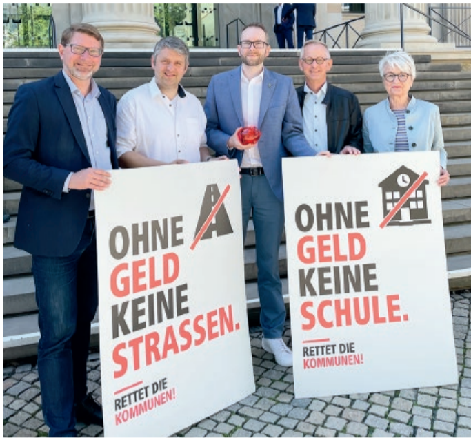
Die Hauptverwaltungsbeamten der Landkreiskommunen mit der Landrätin