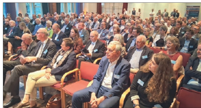
200 geladene Gäste haben im vollbesetzten Forum an der Jubiläumsfeier zu 80 Jahre CDU im Kreis Peine teilgenommen.

ladene Gäste aus Mittelstand, Gewerkschaft, Sport, Kultur, Soziales und Politik auch aus der Region ins Peiner Forum. Er erinnerte an Gründung, Aufbau und Entwicklung der CDU parallel zur Entwicklung Deutschlands unter den zahlreichen CDU-