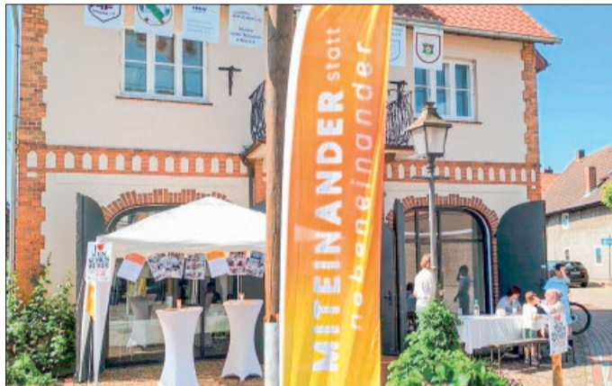
Menschenrechte mahnten, Fahnen und ein Herzentisch luden bei den Aktiven der Kleiderkammer ein.