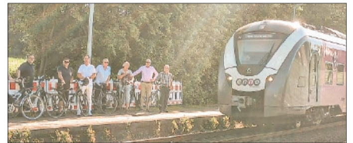
Lengeder Christdemokraten hoffen, dass bald Unkraut und Schotter am Bahnsteig der Vergangenheit angehören.

Nun ist das Feld wieder landwirtschaftlich genutzt, doch nach Insider Informationen soll es Anfang Juli wieder los gehen und der Lagerplatz großflächig eingerichtet werden. Mit der Baumaßnahme will die Deutsche Bahn dann am 10. August starten. Viele Pendler und Bahnreisende werden dann einige