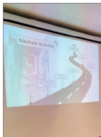
Der Fahrplan von der Infoveranstaltung bis zur Kommunalwahl.