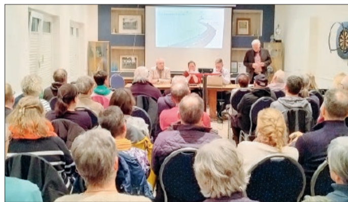
Viele Interessierte waren anwesend, einige mussten stehen.

Nach Darstellung der Initiatoren bestehe die Gefahr, dass bei zu wenigen Bewerbungen kein Gemeinderat konstituiert werden könne. In diesem Zusammenhang wurde ausgeführt, dass in einem solchen Fall die Kommunalaufsicht einen