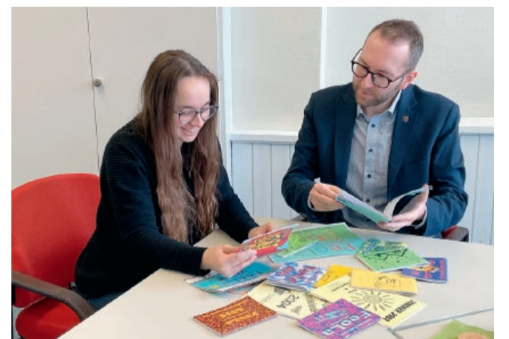
Die ersten Planungen zum „FeoLa“ beginnen