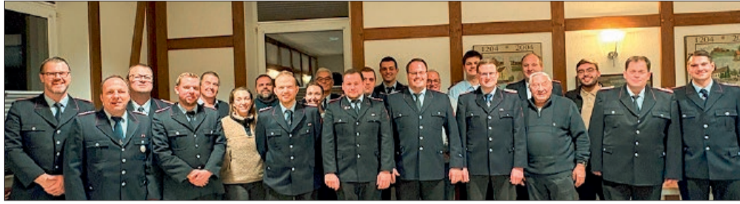
Mitglieder der Gründungsversammlung am 12. Dezember.

Die große Resonanz bei der Gründungsversammlung zeigte bereits, dass die Entscheidung für einen Förderverein genau richtig war. Nach dem Beschluss der Vereinssatzung und der Beitragsordnung sowie der Wahl des Vorstandes waren die Formalitäten schnell erledigt, und der Abend klang in gemütlicher Runde aus. Zweck des Fördervereins der Freiwilligen Feuerwehr Huddessum ist insbesondere die ideelle und materielle Unterstüt-