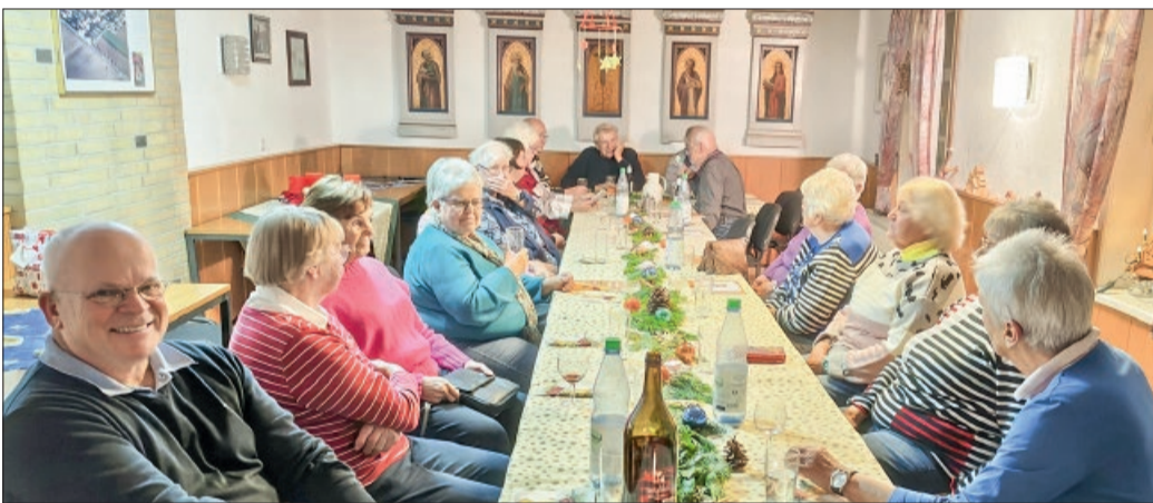
Gemütliches Beisammensein beim Klönnachmittag in Huddessum.