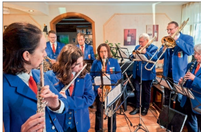
Der Musikzug Klein Förste gratulierte ihrem Ehrenvorsitzenden mit Pauken und Trompeten.