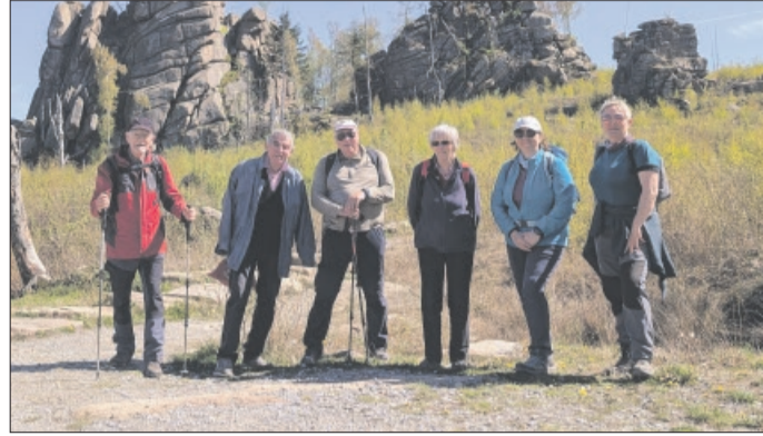
Wendeburger Wanderfreunde beim Ottofelsen

Neben organisierten Treffen und Wanderungen findet jedes Jahr im April eine Saisoneroöffnung der HWN statt. In diesem Jahr beim Waldgasthaus Plessenburg oberhalb des Ilsetals. Und wieder strömten über 1.000 Wanderer aus Ost und West zu diesem Ereignis. Die Wendeburger Wanderfreunde starteten vom Bahnhof Steinerne Renne in Hasse- rode, westlich von Wernigerode gelegen. Ein unscheinbarer Pfad führte abseits der breiten Wanderwege gleich steil empor, vorbei am Wernigeröder Fenster bis zur ersten Stempelstelle Mönchs- buche. Mönche machten hier früher Pause auf dem Weg zwischen