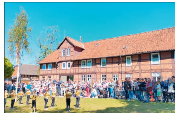
Tanz unter dem Maibaum; das Publikum ist begeistert.