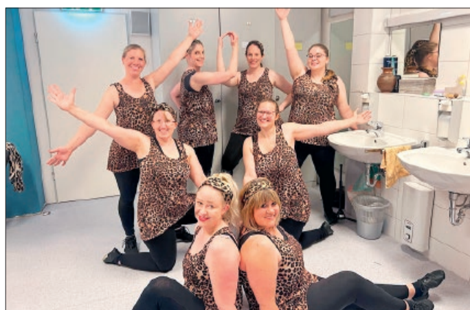
Die Gruppe Tapsi Turtles