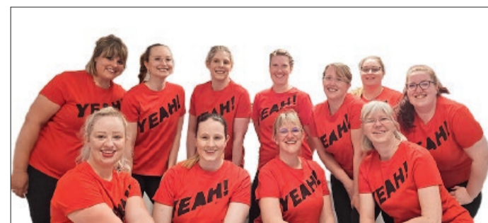
Die Tänzerinnen „Sunnies“