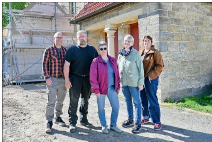
Der Kirchenvorstand der St. Briccius Kirche Adenstedt