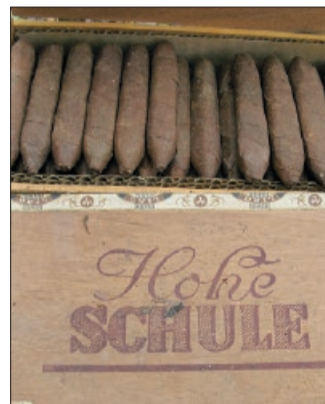
Die Marke „Hohe Schule“ war ebenfalls eingelagert worden.

Der nächste große Wechsel unter den US-Einheiten fand am 18. Mai 1945 statt. Jetzt übernahm die 84. US-Infanteriedivision (Railsplitters) den Großraum Hannover. Der Vorgang wurde im Kriegstagebuch des britischen „Military Government Detachment 122“ in Hildesheim vermerkt: „Came under 84 (US) Division at 1200 today, with HQ in Hannover.“ Das HQ steht für Headquarters (Hauptquartier). Der Eintrag kann wie folgt übersetzt werden: „Kamen heute um 12.00 Uhr unter das Kommando der 84. US-Division, mit Hauptquartier in Hannover.“