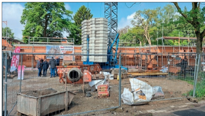
Inzwischen steht bereits der von Bäumen umrahmte Rohbau des eingeschossigen Kindergartens.

Siebzig Jahre Schützenkorps Bekum-Stedum von 1956 e. V.: