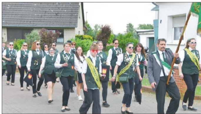
Die Schützendamen aus Bründeln sind beim Umzug auch wieder mit dabei.