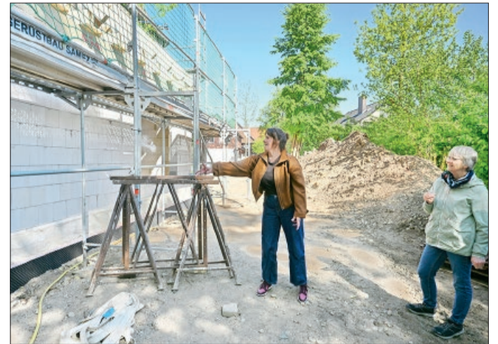
Richtfest des Anbaues an der St. Briccius Kirche

Bei Sekt, Bier und Laugenstangen tauschte man sich über den bisherigen und weiteren Verlauf der Bauarbeiten aus. Im Anbau sind künftig Gemeindebüro, Küche und Toiletten untergebracht. Demnächst erfolgt ein Durchbruch in das Kirchengebäude, um Alt- und Neubau miteinander zu verbinden. Im Kirchenschiff wird anschließend ein Bereich geschaf-