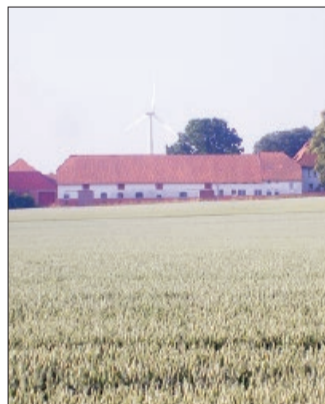
Der ehem. Hof Miede in Bierbergen. Hier befand sich das Warenlager.

Weitere Vorkommnisse wurden von Friedrich Friehe in der Chronik von Harber festgehalten: „Danach erschien ein [amerikanischer] Leutnant der Ortskommandantur Hohenhameln in Harber und verlangte Silberbestecke für das Offizierkasino in Hildesheim, andernfalls würden sie Haussuchungen vornehmen. Daraufhin ging meine Frau und eine Flüchtlingsfrau los und sammelten das Verlangte ein. Darüber stellte der Leutnant eine Quittung aus.“ Anschließend waren auf Anordnung der Militärverwaltung Musikinstrumente für ein Sammel-lager in Lehrte abzugeben. Dort warteten ehemalige Zwangsarbeiter/-innen auf die Rückführung in ihre Heimat. Bald danach erschien wieder ein Leutnant der Ortskommandantur Hohenhameln und verlangte die Abgabe aller Spirituosen, die aus Plünderungen stammten. In der Ummelner Ziegelei hatten sich bis zum Einmarsch der Amerikaner große Mengen Alkohol und Manufakturwaren befunden. „Sie waren aus den von Fliegerangriffen bedrohten Städten ausgelagert worden“, so Friehe in Harber. Das Lager war wie in Bierbergen kurz vor Eintreffen der Amerikaner von der Bevölkerung geöffnet worden. Ähnlich ging es im Seifenlager der Ziegelei Harsum zu. Waggons, die auf den Gleisen am Bahnhof standen, wurden ebenfalls geplündert.