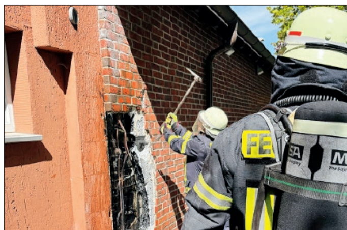
Der Einsatz dauerte insgesamt etwa eine Stunde. Personen wurden nicht verletzt. Jan-Niclas Hollwege

Dank des schnellen Eingreifens konnte eine weitere Ausbreitung des Feuers verhindert werden.