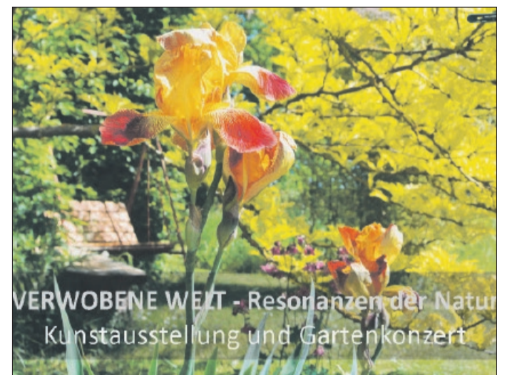
VERWOBENE WELT - Resonanzen der Natur Kunstausstellung und Gartenkonzert

Mehrum. Am 24. und 25. Mai laden wir Sie und Euch herzlich zur Pfingstveranstaltung im Kunsthof Mehrum ein.