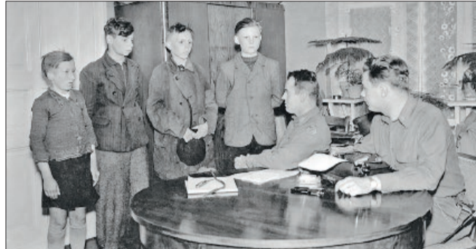
Vier Jungen bei einer Vernehmung durch einen US-Offizier. Ihnen wurde vorgeworfen, einen US-Fernmeldedraht durchtrennt zu haben.

Nach Eintreffen übernahm das US-Militär die vollständige Kontrolle. Dabei wurden die Einhaltung der Ausgangssperre überwacht und die Suche nach versprengten deutschen Soldaten sowie flüchtigen NS-Größen fortgesetzt. Festnahmen waren die Folge. Dies kann in den Berichten der Division nachverfolgt werden. Darüber hinaus wurde ein Jugendlicher aus Klein Solschen in Hohenhameln festgenommen. Er hatte die Pistole eines US-Soldaten entwendet und im Garten vergraben. Untersuchungen ergaben, dass mehrere Jungen im Alter von 12 bis 16 Jahren dabei waren, sich Pistolen anzueignen. Mehrere aus dieser Gruppe wurden in Gegenwart ihrer Eltern strengstens ermahnt. Jeder weitere Versuch wäre strengstens bestraft worden. Die US-Soldaten nahmen zum Glück an, dass die Jungen nicht aus gegnerischer Absicht gehandelt hätten. Vielmehr wurde von einem „Dummejungenstreich“ ausgegangen, um in den Besitz eines solchen „Souvenirs“ zu gelangen.