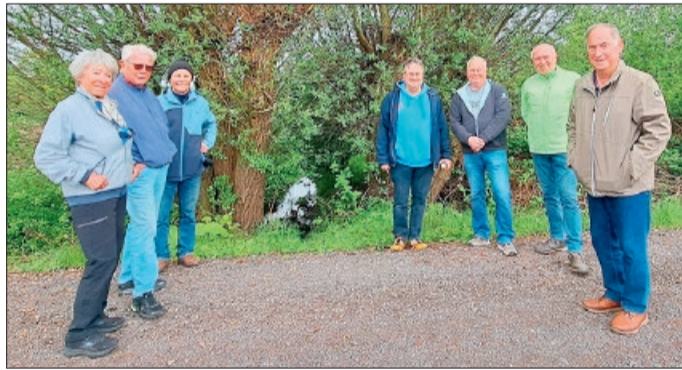
An der Aue bei Equord. Sie fließt durch Burgdorf und verzweigt sich nördlich von Obershagen in die Neue und Alte Aue. Letztere mündet nach 47,8 km in den Fuhsekanal.