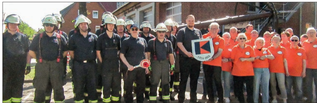
Feuerwehr und Kolpinger in Reih und Glied

besteht schon seit Jahrzehnten und wird durch Fahrten nach Brasilien und Besuch der Brasilianer hier in Harsum immer