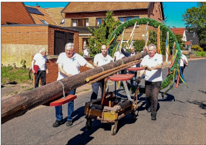
Vom Hofe Algermissen bringen die Adlumer Sänger den Maibaum zum Brink.

Anschließend wurde der Maibaum zügig errichtet. Unter den blühenden Kastanien des Adlumer Brinks sorgten die Sänger des MGV Adlum dann