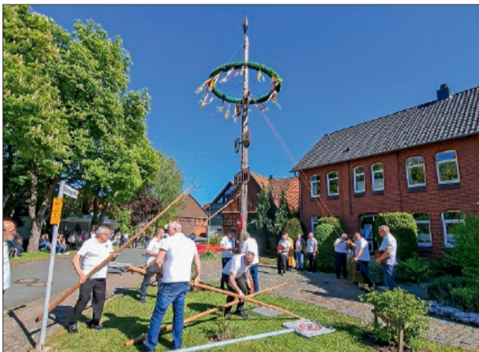
Mit vereinten Kräften wurde der Baum errichtet.

Adlum. Bei strahlendem Frühlingswetter wurde traditionell wieder der Maibaum in Adlum aufgestellt. Bereits am Nachmittag hatten sich zahlreiche Besucher bei Kaffee und mehr als 15 selbstgebackenen Kuchen auf das Fest eingestimmt.