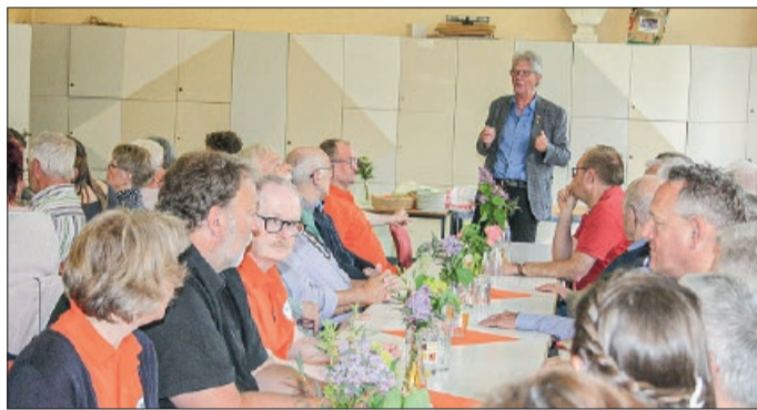
Blick in die Versammlung