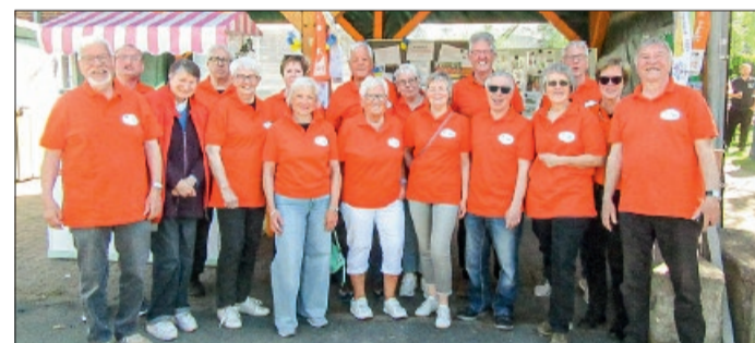
Die Kolpinger in ihren neuen Shirts

Tierheim Hildesheim befindet sich im Um-/Neubau: