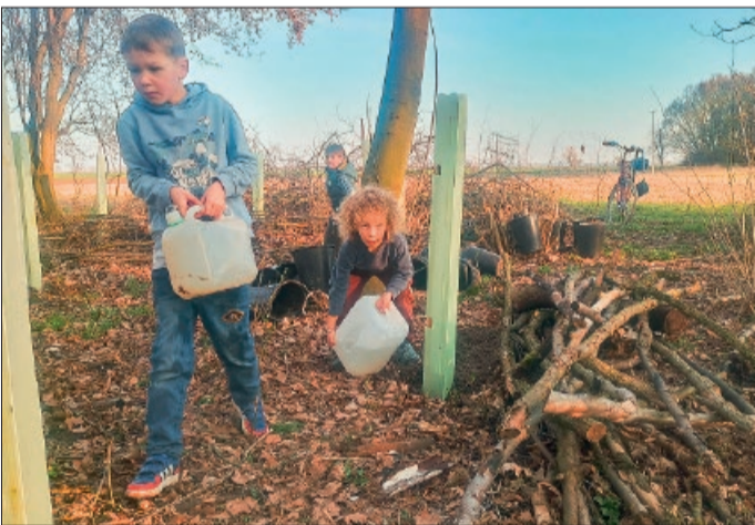
Die Kinder halfen beim Angießen der Bäume mit.