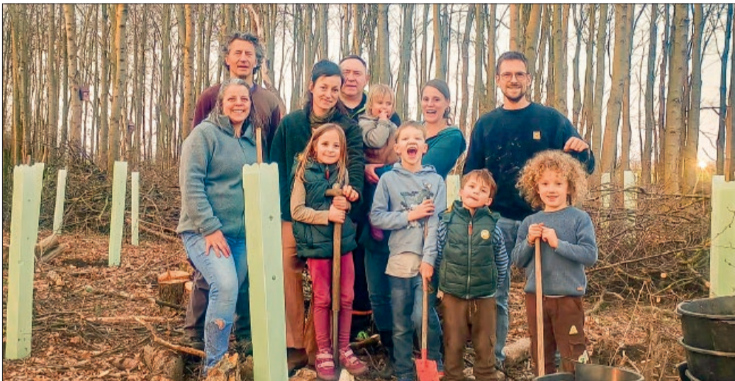
Die Gruppe nach getaner Arbeit