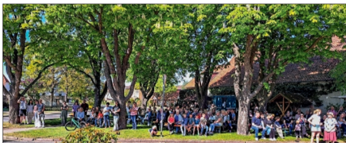
Zahlreiche Besucher fühlten sich unter den blühenden Kastanien des Adlumer Brinks wohl.