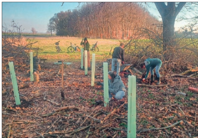
Die Bäume werden in dem kleinen Wäldchen gepflanzt.