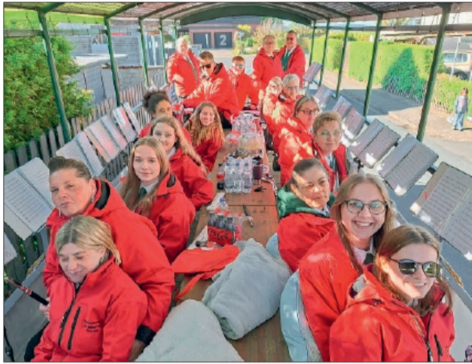
Mit flotter Musik zogen die Aktiven des Stammzuges auf dem Festwagen zum Maiwecken durchs Dorf.