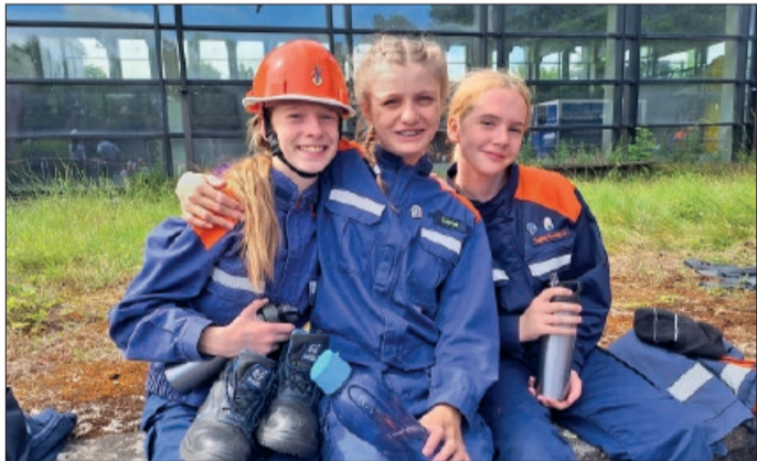
Pause auf dem Landeswettbewerb 2024 in Duderstadt.

Vechelde. Wenn es Mittwoch 18 Uhr schlägt, ist bei uns im Feuerwehrhaus hier in Vechelde mit gut gelaunten, 10- bis 18-Jährigen, zu rechnen. Sobald alle da sind, geht es los. Manchmal haben wir Fahrzeugkunde, damit alle wissen, mit was für Werkzeuge im Einsatz gearbeitet wird, um anderen zu helfen. Damit wir nicht nur Fahrzeugkunde haben, backen wir manchmal Pizza, oder im Winter auch einmal Plätzchen. Im Sommer üben wir so ziem-