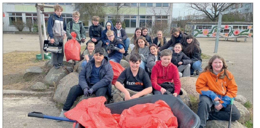
Fleißige Müllsammler aus der 6b

„Umweltschutz, Verantwortung übernehmen, Gemeinschaft fördern – das sind die Triebfedern der Aktiven, die bereits in den letzten Jahren immer am Akti-