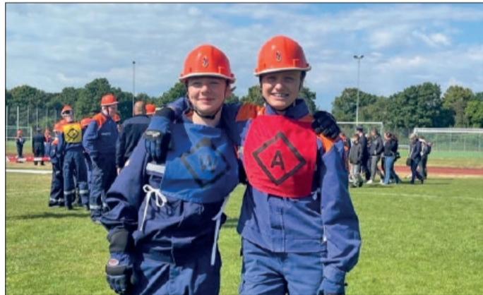
Mit der besten Freundin beim Kreiswettbewerb.

Die bestehen aus dem sogenannten Löschangriff und dem Staffellauf. Bedeutet: beim Löschangriff wird eine Schlauchleitung von der Pumpe über einen Wassergraben bis hin zum Verteiler und unter, bzw. durch Hindernisse bis vorne zum endgültigen Angriff von drei unterschiedlichen Trupps gelegt. Das ist einmal der Wassertrupp, der Schlauchtrupp und der Angriffstrupp. Im Staffellauf