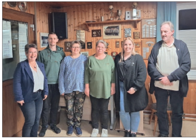
Die Geehrten für 25 Jahre Mitgliedschaft