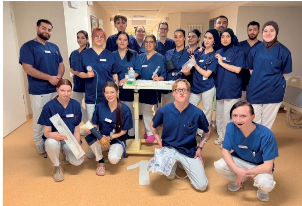
Erfolgreiches Praxisprojekt: Auszubildende des Bildungszentrums steuerten drei Wochen lang alle Abläufe auf Station 1, inklusive interdisziplinärer Kommunikation mit Ärzten und Therapeuten.