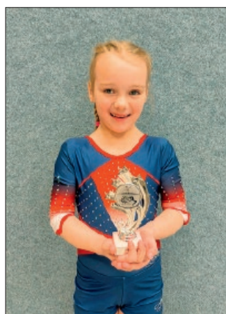
Nia erturnte sich bei ihrem ersten Einzelwettkampf einen hervorragenden zweiten Platz.

Im Anschluss wagte sich Lotte Woltermann zum ersten Mal in der anspruchsvollen Leistungsklasse 2 an den Start. Der Beginn am Sprung und Stufenbarren lief sehr zufriedenstellend, doch am Schwebebalken machten sich zunächst Selbstzweifel breit. Nach gutem Zuspruch durch ihre Trainerinnen Silke Schreiner und Katja Winde Seeger nahm sie dann allen Mut zusammen und lieferte eine technisch saubere und anspruchsvolle Übung mit einer Verbindung aus einem