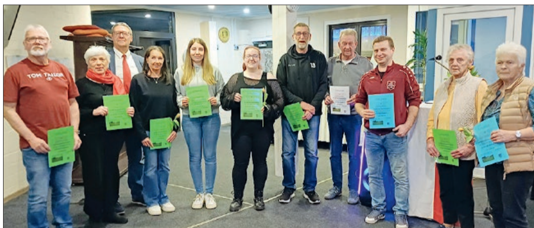
Der erste Vorsitzende mit den Jubilaren.