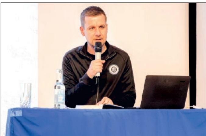
Der Autor sprach nicht nur über seine Erlebnisse auf dem Jakobsweg, sondern gab unter anderem auch Einblicke in seine Arbeit als Notfallsanitäter.