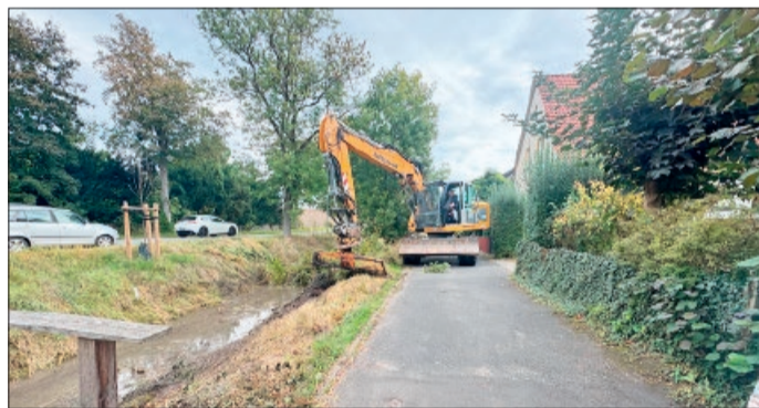
Pflegemaßnahmen am Neuen Graben