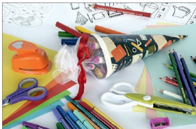
Mit dem Schulstartprojekt unterstützt der Landkreis Hildesheim über den Sozialfonds Region Hildesheim Familien mit geringem Einkommen.

Familien mit geringem Einkommen können für ihr Kind, das in die erste Klasse kommt, ab sofort bis zu 100 Euro bei den Beratungsstellen der Arbeiterwohlfahrt, des Caritasverbandes und des Diakonischen Werkes in der Stadt und im Landkreis Hildesheim beantragen. Termine können bei den Beratungsstellen direkt vereinbart werden, sobald