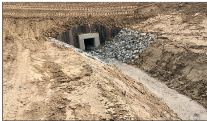
Regenrückhaltebecken zwischen Hackenstedt und Sottrum