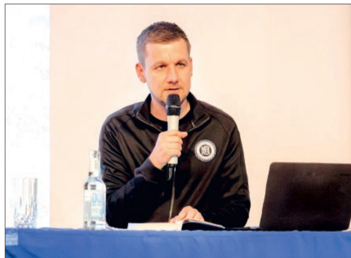
Der Autor sprach nicht nur über seine Erlebnisse auf dem Jakobsweg, sondern gab unter anderem auch Einblicke in seine Arbeit als Notfallsanitäter.