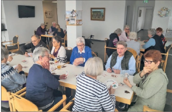
Rommeeturnier im Seniorentreff

Das Programm im Seniorentreff der Gemeinde Vechelde zeigte sich auch im Frühjahr sehr abwechslungsreich. Zwei Höhepunkte lockten zahlreiche Seniorinnen und Senioren in die Räumlichkeiten im 2. Stock des Dornberg Carrees und sorgten für gute Laune sowie einen angenehmen gesellschaftlichen Austausch. Zunächst stand im Januar 2026 ein Rommeeturnier auf dem Programm. Beim gemütlichen Zusammensein wurden Taktik, Gedächtnis und Schnelligkeit gefördert und die gute Laune blieb dabei auch nicht auf der Strecke. Das Turnier bot den Teilnehmenden Gelegenheit, Kontakte zu pflegen und den Tag gemeinsam zu genießen. Im Februar lud der Seniorentreff bei einem Gesangsnachmittag dazu ein, sich von bekannten Melodien und einem entspannten Ambiente verzaubern zu lassen. Von Dietmar Niedzwecky mit der Gitarre begleitet, wurden bis in den frühen Abend viele altbekannte Lieder gemeinsam gesungen. Auch seine Soli kamen sehr gut an. Die Mitarbeiterinnen der Gemeinde Vechelde, Frau Drost und Frau Schäfer, freuen sich sehr über die positive Resonanz und planen bereits weitere gemeinsame Aktivitäten, um den Austausch unter den Seniorinnen und Senioren aus der Gemeinde zu fördern und ihnen einen Raum für Begegnung zu bieten. Die aktuellen Termine und Veranstaltungen des Seniorentreffs sind auf der Homepage der Gemeinde Vechelde ( www.vechelde.de/leben/senioren ) sowie im Aushang im Dornberg Carree zu finden.