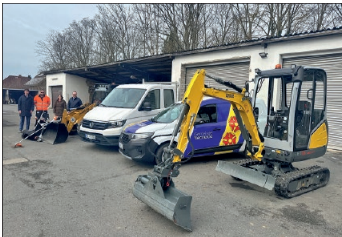
Die neuen Fahrzeuge auf dem Bauhof.

„Der Bauhof der Gemeinde Vechelde stellt einen elementar wichtigen Bestandteil des öffentlichen Zusammenlebens in unserer Gemeinde dar. In den insgesamt 17 Ortsteilen übernimmt der Bauhof vielfältige Aufgaben – Grünpflege, Reinigung, Winterdienst, Reparaturen, Unterhaltung von Spielplätzen, Dorfgemeinschaftshäusern, Kindergärten, Schulen, Straßen, Wegen und Plätzen und vieles