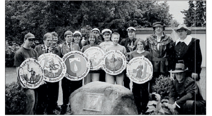
Die Schützenkönige aus dem Jahr 2001 bei der 850-Jahrfeier

Bodenstedt. Die älteste bekannte Erwähnung unseres Dorfes Bodenstedt befindet sich auf einer Urkunde aus dem Jahr 1151. Das ist ein guter Grund, das 875-jährige Dorfjubiläum zu feiern. Zum Auftakt des Jubiläumsjahres lädt die Festgemein-