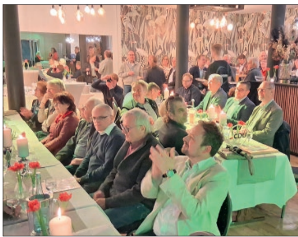
Festliches Ambiente zur gut besuchten CDU-Mitgliederversammlung in der Peiner Tanzschule.