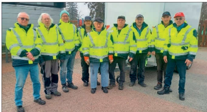
Rentnerband mit neuen Jacken vor dem Maschinenanhänger der Gemeinde Holle.

Heersum. Die Beteiligung bei der Rentnerband in Heersum ist in den letzten Jahren konstant bei 12 Personen geblieben und mit wenigen Ausnahmen sind auch fast immer alle anwesend. Für die kalte Jahreszeit hat die Rentnerband nun vorgesorgt, von den Zuschüssen der Gemeindeverwaltung Holle wurden für den Winter neue einheitliche Jacken angeschafft. Anfang des Monats wurde auch zum ersten Mal der neue Maschinenanhänger des Bauhofes der Gemeinde Holle in Beschlag genommen.