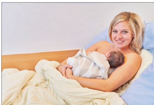
Rundum gut versorgt in der Geburtshilfe im St. Bernward Krankenhaus.

Die Elternschule des St. Bernward Krankenhauses veranstaltet jährlich zahlreiche Kurse für Schwangere und ihre Partner sowie für frischgebakene Eltern. An verschiedenen Ständen können Sie sich zu unseren Kursangeboten informieren und sich auch gleich schon für Kurse anmelden.