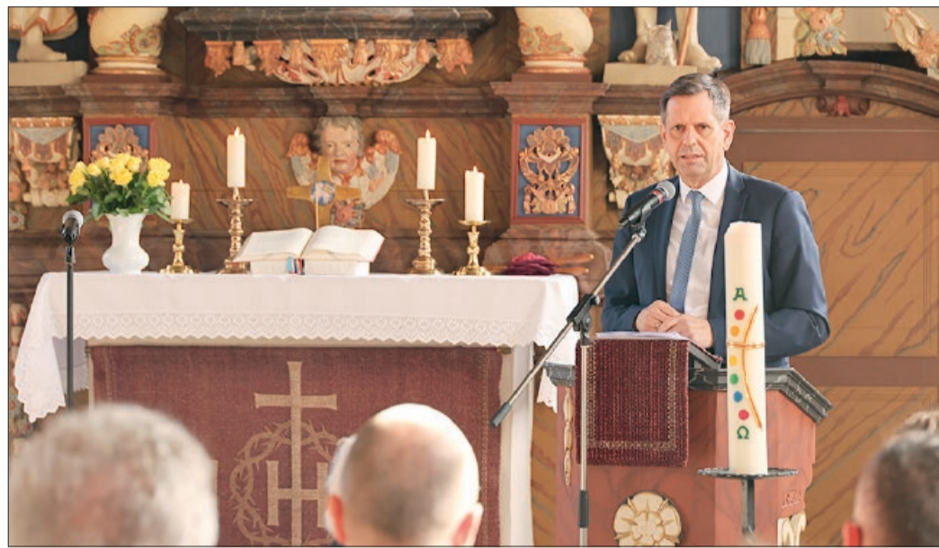
Niedersachsens Ministerpräsident Olaf Lies sprach bei der Heersumer Kanzelrede.

Ministerpräsident Lies war an diesem Sonntag eigens aus Wilhelmshaven angereist. Die Heersumer Kirche erinnere ihn an seine Heimatkirche in Neustadtgödens (Friesland), sagte er zu Beginn. Kirche sei ein besonderer Raum. Zwar seien Staat und Kirche getrennt, und die Neutralität des Staates sei gut und richtig – dennoch gebe es viele verbindende Anliegen: das gemeinsame Bemühen, Menschen zu erreichen und Orientierung zu geben. Angesichts weltweiter Krisen, von der Ukraine über Gaza bis jüngst zum Iran, sprach Lies von einer angespannten Zeit, in der viele Menschen Verunsicherung und Bedrohung empfänden. Steigende Kosten im Gesundheitswesen, Fragen