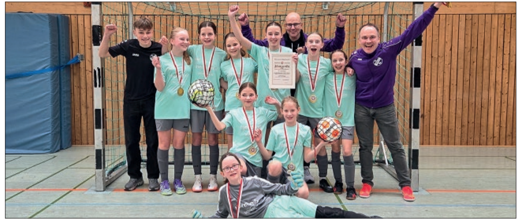
Die Mädchen und das Trainerteam der D-Juniorinnen freuen sich über die gewonnene Hallenkreismeisterschaft.

Förste. Mit über die komplette Hallensaison konstant souveränen Leistungen konnten die Förster D-Mädchen auch in diesem Jahr die Hallenkreismeisterschaft gewinnen.