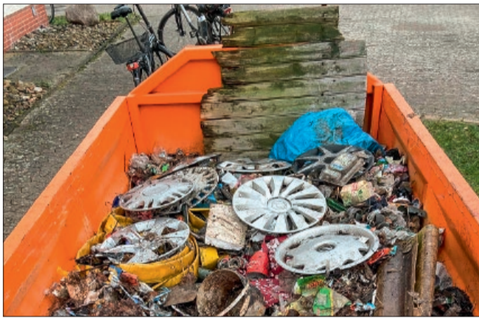
Ein Blick in den gefüllten Müllcontainer