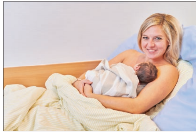
Rundum gut versorgt in der Geburtshilfe im St. Bernward Krankenhaus.

Ihre Kinder können Sie während der gesamten Veranstaltung von unseren Erzieherinnen betreuen lassen. Schwangere können sich als Erinnerung an ihre Schwangerschaft ihren Babybauch professionell fotografieren lassen. Außerdem können die Besucher an Gewinnspielen teilnehmen und unseren Latenzphasenraum sowie die Hebammenpraxis besichtigen. Im Gesundheitsinformationszentrum besteht die Möglichkeit, einen Termin zur Hebammensprechstunde zu vereinbaren.