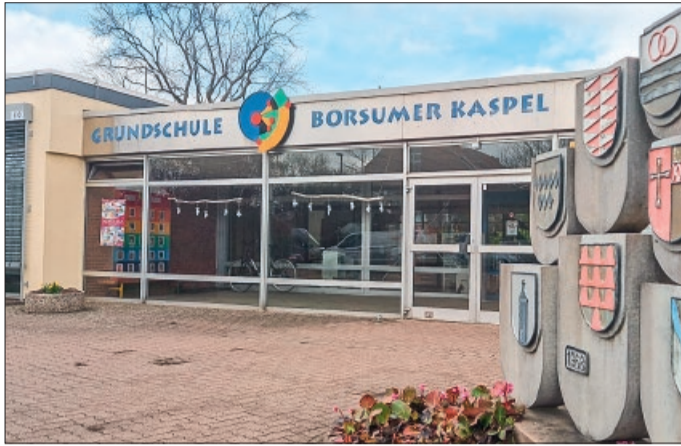
Die Grundschule Borsumer Kaspel ist eine der beiden Grundschulen, die im kommenden Schuljahr zu Ganztagschulen werden.

In Borsum müssen beispielsweise Dach und Fenster erneuert werden, in Harsum besteht unter anderem ein feuchter Keller.