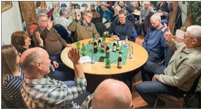
Gut besuchte Mitgliederversammlung in der Adlumer Bodega.