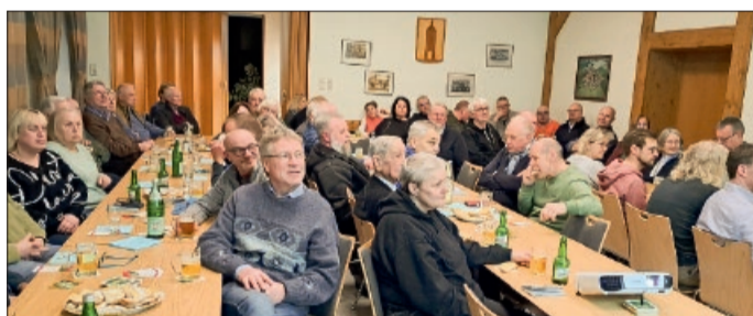
Viele Besucher kamen zum Bürgerabend ins Dorfgemeinschaftshaus.