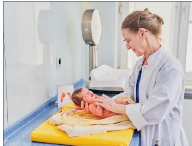
Wir sorgen für einen guten Start ins Leben.

Am Tag der offenen Geburtsklinik haben Sie die Möglichkeit, sich an mehreren Ständen zu verschiedenen Angeboten für Schwangere und frisch gebackene Eltern beraten zu lassen. Es stellen sich unter anderem unsere Babylotsinnen, die sozialmedizinische Nachsorge Penelope und die Kinderintensivstation E3 vor sowie viele unserer Kooperationspartner: die Hebammerei & Familienbegleitung „Nestglück“, die Frühen Hilfen des Landkreises Hildesheim, der Caritasverband für Stadt und Landkreis Hildesheim, die Hebammenpraxis Hildesheim, der Sozialdienst Katholischer Frauen e.V., der Vätertreff der Katholischen Erwachsenenbildung und Vita34.