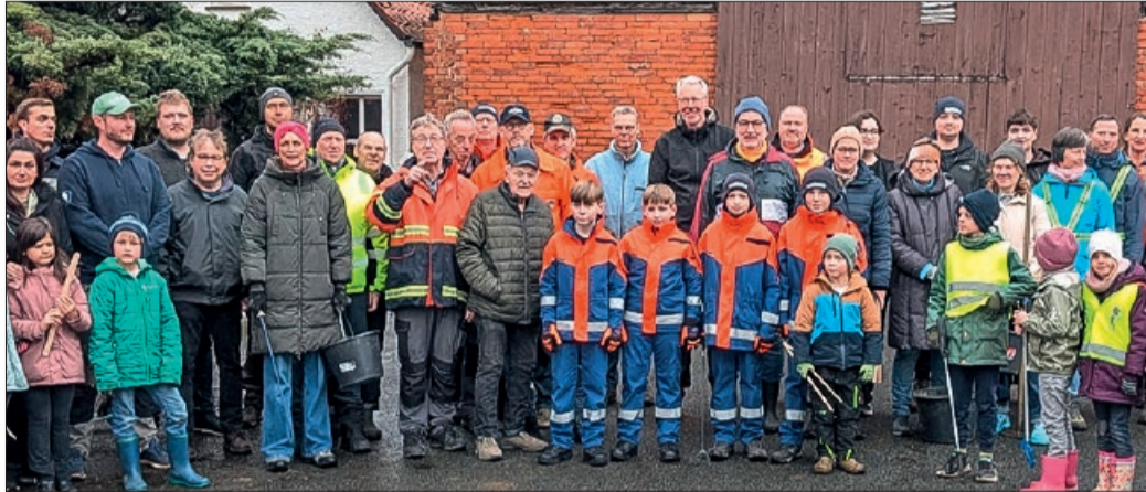
Mit Besen, Harke, Greifzangen und Tonnen machten sich 65 große und kleine Helferinnen und Helfer an die Arbeit.

Darüber hinaus kümmerten sich die Freiwilligen um mehrere zentrale Orte im Dorf. Der Dorfplatz am Brink mit seinem Heidebeet wurde ebenso von Müll befreit wie der Kinderspiel- und Bolzplatz, auf dem vor allem das über den Winter angesammelte