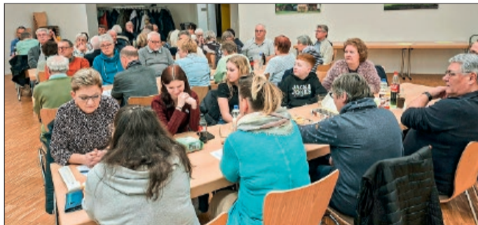
Die Versammlung war mit 55 Teilnehmern sehr gut besucht und es gab durchweg nur einstimmige Beschlüsse.