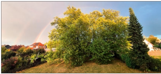
Dieser wertvolle Baumbestand auf dem Grundstück der KWG in Borsum ist leider beseitigt worden.

Die vom Naturschutzverein, vom Ortsrat und von der Arbeitsgemeinschaft Borsumer Vereine organisierte Aktion „Saubere Landschaft“ ist auch in diesem Jahr erfolgreich verlaufen. Rund 50 Teilnehmer*innen, vor allem Kinder und Jugendliche, unterstützten die wichtige Müllsammelaktion am Waldrand, in den Straßengräben rund um