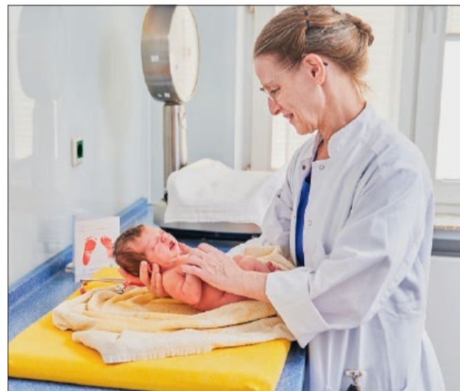
Wir sorgen für einen guten Start ins Leben.

Wir wünschen Ihnen und uns einen spannenden und informativen Tag und freuen uns auf Sie und Ihr Baby!