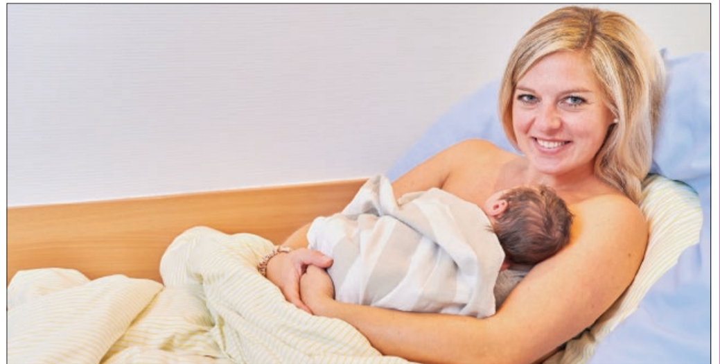
Rundum gut versorgt in der Geburtshilfe im St. Bernward Krankenhaus.

Ihre Kinder können Sie während der gesamten Veranstaltung von unseren Erzieherinnen betreuen lassen. Schwangere können sich als Erinnerung an