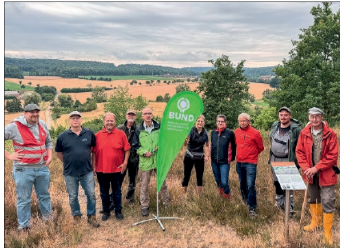
Foto vom Arbeitseinsatz im Sommer des letzten Jahres.

Barienrode. Am Samstag, 18. April, ab 9.30 Uhr startet der erste Arbeitseinsatz des Jahres im Naturschutzgebiet Schwarze Heide bei Barienrode. Die Heide soll auch in diesem Jahr wieder wunderschön blühen. Dafür muss sie regelmäßig von der Konkurrenz durch Pappel- und Birkenschösslinge befreit werden, die die Heidesträucher schnell überwuchern würden.