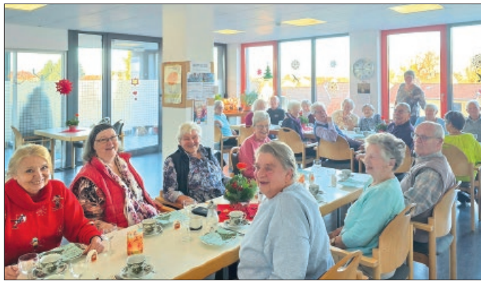
Weihnachtsfrühstück im Seniorentreff Vechelde im Dornbergcarree.

Mit Herz und organisatorischem Geschick schufen sie eine herzliche Atmosphäre, in der die Begegnung im Vordergrund stand. Den Gästen konnte ein leckeres Frühstück sowie einige kleine Aufmerksamkeiten angeboten werden.