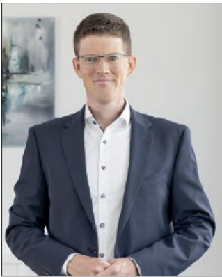
Bürgermeister Tobias Grünert

Fernerhin rückt die Hildesheimer Str. in Vechede in den Fokus. Das Verkehrskonzept – erstellt durch ein externes Planungsbüro – liegt vor und beginnt mit dem Abschnitt „Bahnhof – Wähler Weg“ soll die Hildesheimer Str. Stück für Stück attraktiver für alle