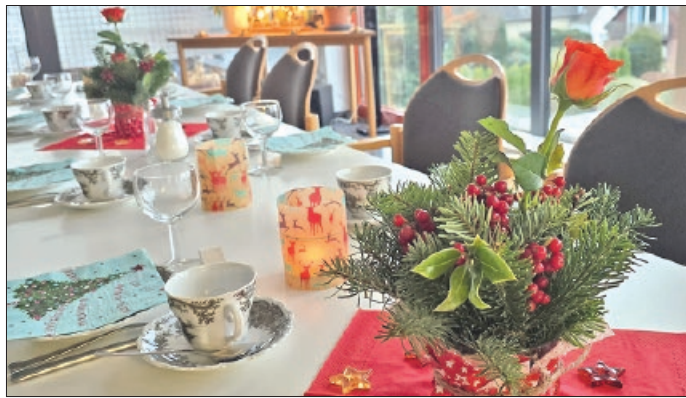
Weihnachtsfrühstück im Seniorentreff Vechelde im Dornbergcarree.

In diesem Jahr fand das beliebte Weihnachtsfrühstück des Seniorentreffs der Gemeinde Vechelde wieder in zwei Durchgängen statt. „Gemeinsam statt einsam“ lautete das Motto, unter dem die Veranstaltung erneut Seniorinnen und Senioren zu einem geselligen Vormittag zusammenbrachte.