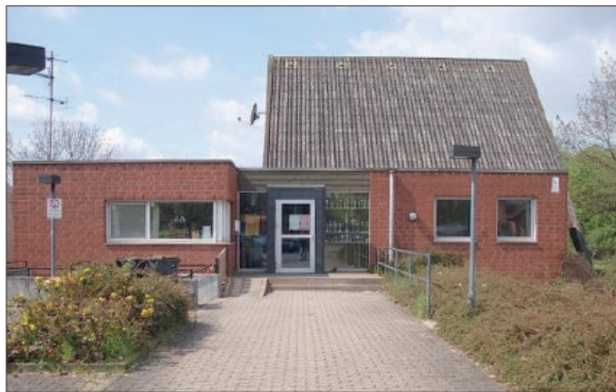
Kinder- und Jugendzentrum in Vechelde

Darin enthalten sind auch sämtliche Kosten für die Verpflegung (Getränke, Frühstück und Mittagessen) und Sachkosten. Anmeldungen werden ab sofort im Kinder- und Jugendzentrum Vechelde, Am Windmühlenberg 1a, in Vechelde, entgegengenommen. Es gelten die Vertragsgrundsätze der Gemeinde Vechelde. Diese können unter www.vechelde.de/leben/familien-kinder-jugendliche/kinder-und-jugendarbeit/ eingesehen werden. Für Rückfragen steht Ihnen das Team der Jugendpflege, Tel. 05302-1725 gern zur Verfügung.