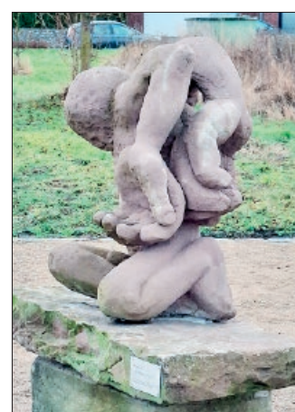
Die Skulptur „Der Knieende“ auf der neu geschaffenen Anlage am Ackerrain in Hohenhameln.

Viele seiner Werke sind durch Vertreibung und Gewalt im