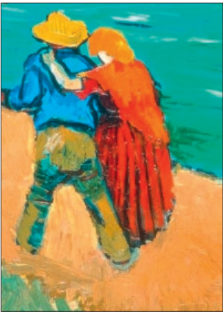
Ausschnitt aus dem Bild „Liebespaar in Arles“ von Vincent van Gogh.