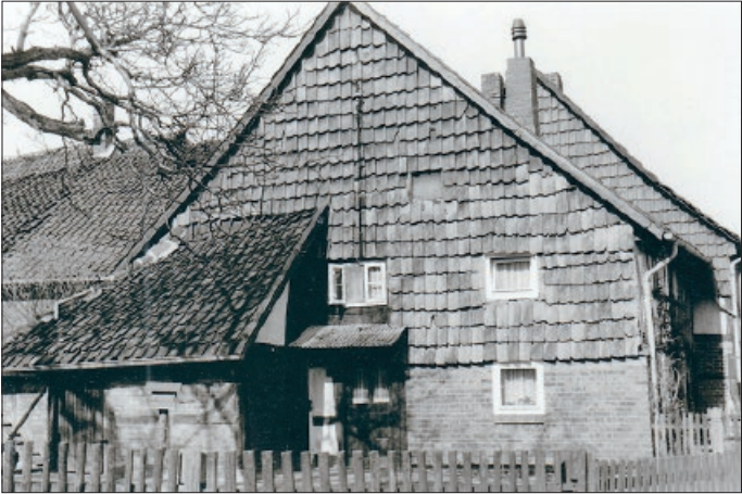
Das Wohnhaus Nr. 25 in Hinter den Höfen.

Das Wohnhaus Nr. 25 gehörte dem Vollköthner Jürgen Meyers. Es entstand um 1734. Die Gemeinde Hohenhameln errichtete dann im Jahre 1880/81 auf dem Gelände des Kuhlhirtenhauses ein Armenhaus. Den Auftrag übernahm das Baugeschäft Carl Hüsig. Im linken Teil des Gebäudes befand sich auch ein einzelner Raum für Leute, die auf Wanderschaft waren. Das Haus mit den darin befindlichen Wohnungen verblieb bis 1975 im Besitz der Gemeinde.