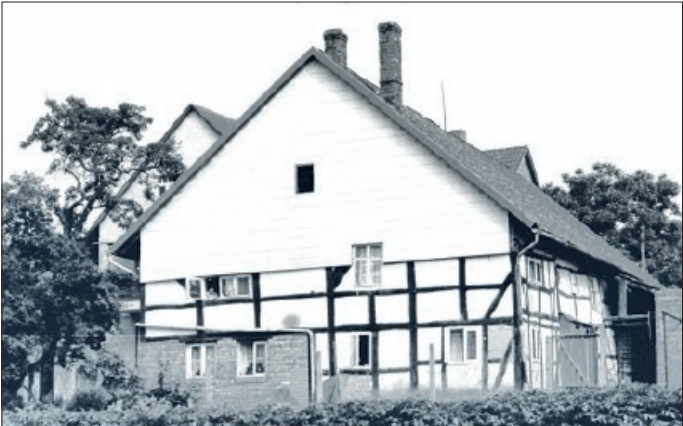
Die ehem. Bauernschäferei (Wohnhaus) in Hinter den Höfen (Nr. 44)