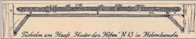
Türholm am Haus „Hinter den Höfen“ Nr. 43 (1742)