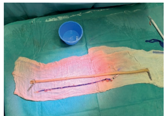
Das 80 Zentimeter lange Bypass-Transplantat: Das Team setzte auf eine biologische Gefäßprothese aus Rinderhalsschlagader sowie körpereigener Vene.