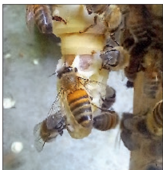
Eine verdeckelte Königinnen-Zelle.

Für die Zuchtarbeit steht der umtriebige Bienenfachmann schon mal vor dem ersten Hahenschrei auf oder experimentiert bis tief in die Nacht. Seine Beobachtung: „Die Klimaveränderung hat immer stärkeren Einfluss auf die Zuchtarbeit. Wirtschaftlich betrachtet ist das schwierig, doch aus Züchtersicht äußerst spannend. Denn Königinnen mit viel Power halten auch extreme klimatische He-