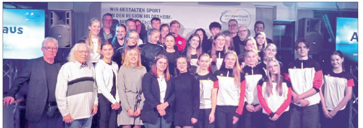
Die geehrten Sportlerinnen und Sportler mit den Organisatoren der Veranstaltung.

Hildesheim. Der Kreissportbund Hildesheim führte die dritte Auflage des neuen Veranstaltungsformates „APPLAUS“ durch. Etwa 100 Gäste gaben der Feier in der mit moderner Veranstaltungs- und Lichttechnik hergerichteten Lehrstätte erneut einen würdigen Rahmen. Insgesamt wurden 46 erfolgreich Sporttreibende in 8 verschiedenen Sportarten mit viel „Applaus“ geehrt, 10 Einzelsportler und 3 Mannschaften.