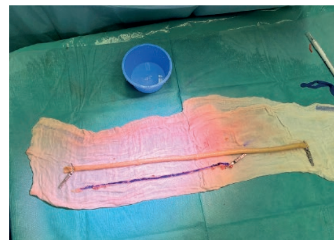
Das 80 Zentimeter lange Bypass-Transplantat: Das Team setzte auf eine biologische Gefäßprothese aus Rinderhalsschlagader sowie körpereigener Vene.