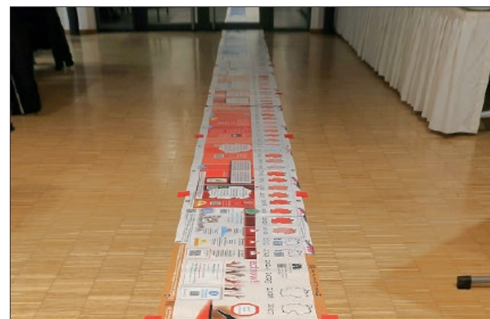
Ein Zeitstrahl zur Erderwärmung auf dem Boden des Sitzungssaals machte die Dringlichkeit des Klimaschutzes deutlich.