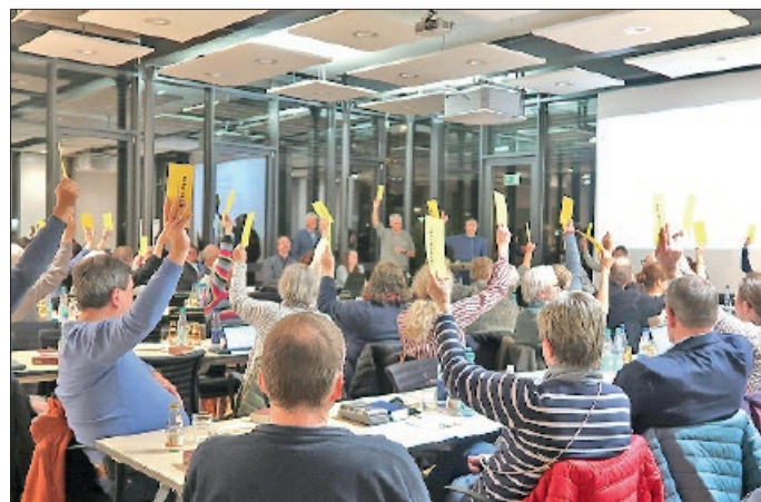
Für das Klimaschutzmanagementkonzept gab es breite Zustimmung in der Synode.