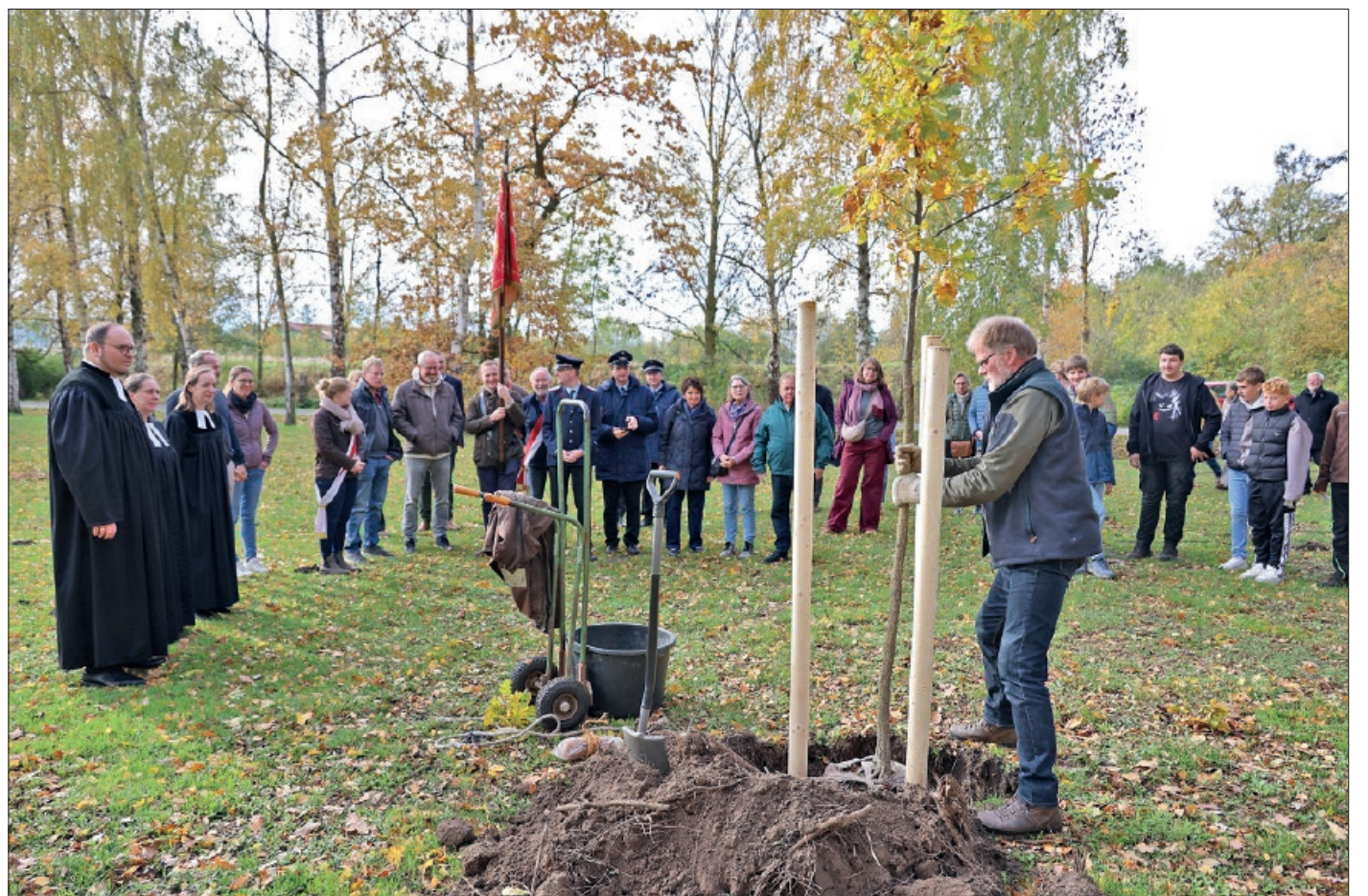
Nach dem Gottesdienst pflanzten die Teilnehmenden einen Baum.