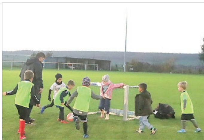
Die jüngsten Talente waren mit Begeisterung bei der Sache.