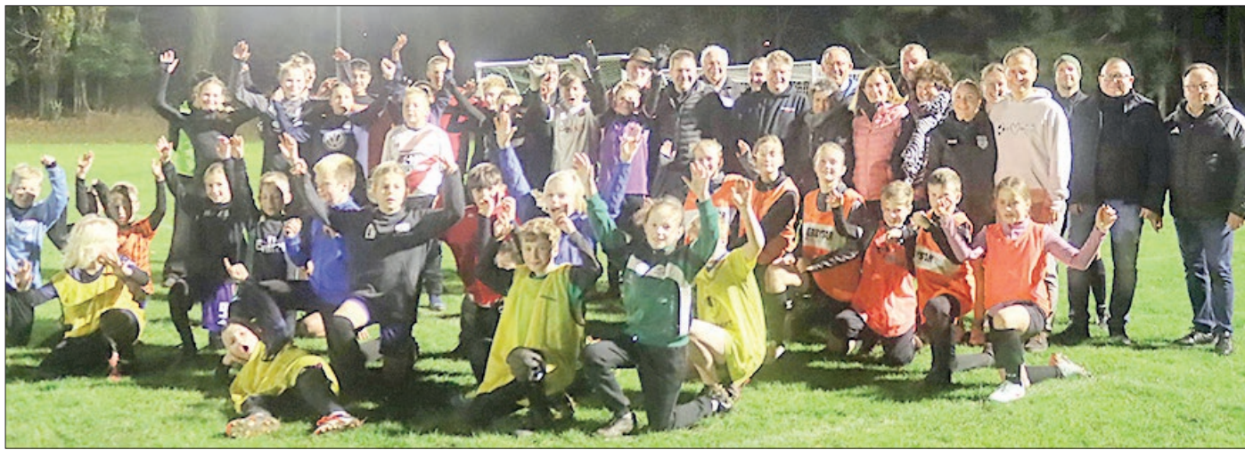
Gäste, Sponsoren und die Fußballtalente der SG Steinlah/Haverlah bejubeln das Einschalten der neuen Flutlichtanlage in Steinlah.