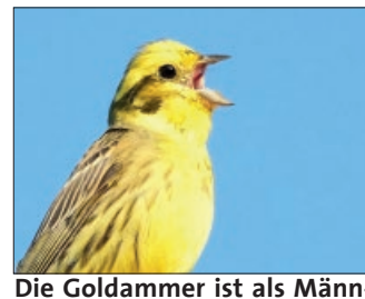
Die Goldammer ist als Männchen ein leuchtend kleiner Fleck in der Natur, sehr schreckhaft und ist am Steinhuder Meer „eingefangen“ worden.

Ehrungen für langjährige Verlagszugehörigkeit und besonderes Engagement: