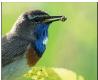
Das Blaukehlchen ist farbig gut zu erkennen, bleibt im Verborgenen, doch auch in Lengede gefunden.