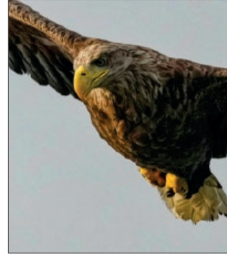
Der Seeadler sieht zwölf Mal besser als der Mensch, hat eine Flügelweite bis 2,80 m und wurde am Steinhuder Meer aufgenommen.

kommt für den Fotokünstler dann aber auch die Technik, der Umgang mit den sich rasant weiter entwickelnden Möglichkeiten moderner Kameras, dazu. Allerdings würden seine Bilder kaum nachbearbeitet, wie Löper betont. Für die Werke dieser Ausstellung hat er gut zwei Jahre Vorbereitungszeit benötigt, doch von seinen Besuchern erwartete er dagegen nur „in jedes Foto für mindestens fünf Sekunden einzutauchen“.