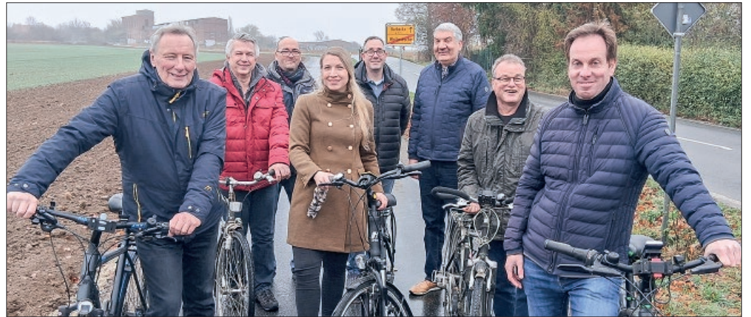
Die Woltwiescher CDU-Gruppe konnte die offizielle Einweihung nicht abwarten und unternahm schon einmal eine Probefahrt auf der neuen Radwegeverbindung nach Barbecke.

Durch massiven Einsatz, auch der Gemeindeverwaltung und – Politik, ist nach einer verhältnismäßig kurzen Planungs- und Bauzeit die Fertigstellung noch vor dem Wintereinbruch gelungen. Kleine Verzögerungen gab es zwar durch archäologische Untersuchung mit Funden aus dem 7. Jahrhundert unter der Radwegtrasse, doch hier halfen behutsame Erdarbeiten der verständnisvollen Baufirma für eine gute konservatorische Sicherung. Etwas robuster ging es dagegen bei einem Erdkabel zu, denn kräftige Maschinen