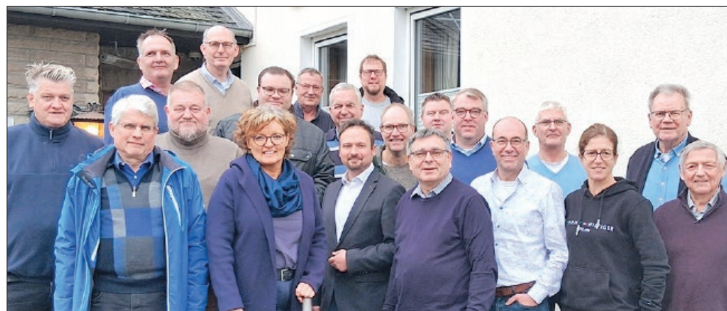
Die Kommunalpolitiker von CDU und FDP berieten jetzt einen Tag den Kreishaushalt 2026 mit einer weiter dramatischen Schuldenentwicklung.