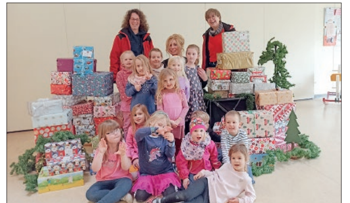
Die Päckchen in der Kita Oberg können abgeholt werden.

2024 wurden deutschlandweit über 147.000 Päckchen gesammelt und verteilt – in diesem