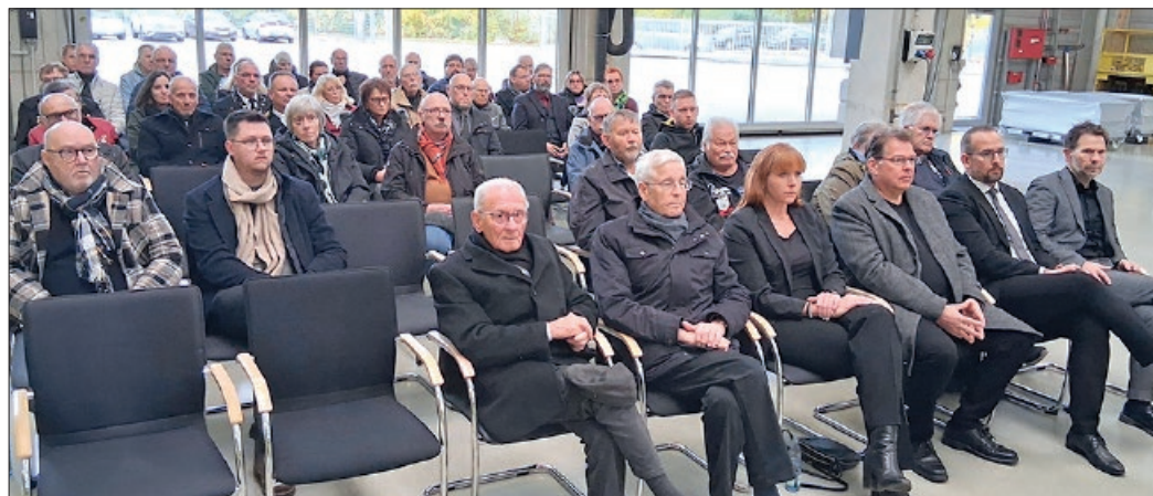
Nach dem Gedenken am ehemaligen Bergungsort nahmen die Gäste aus Politik, Verwaltung und zahlreiche Bürger, an der Vortragsveranstaltung teil.

CDU und FDP beraten dramatischen Haushalt 2026 / Über 50 Millionen Euro Minus in einem Jahr: