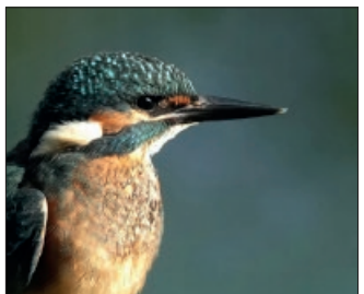
Der Eisvogel ist klein und scheu, hat blaues, türkises bis oranges Gefieder und wurde an den Lengeder Teichen entdeckt.