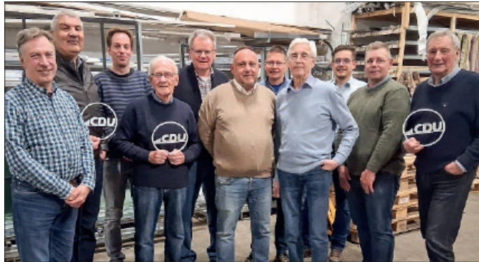
Die CDU-Fraktion im Regionalverband Großraum Braunschweig, besichtigte die Baustelle und die mit 24 Millionen Euro teuerste Investition der KVG in ihren neuen Bus-Betriebshof Lebenstedt.