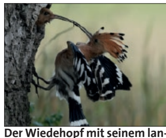
Der Wiedehopf mit seinem langen Schnabel ist ein Sommergast aus dem Süden, sehr selten, aber unverkennbar wurde er in Brandenburg gefilmt.