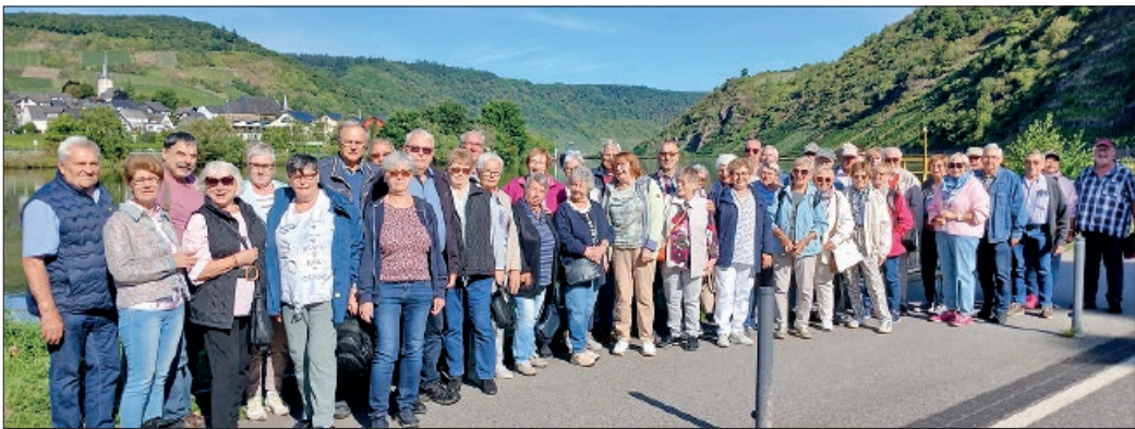
Die Reisegruppe der KfV-Senioren am Schiffanleger in Beilstein.

Wir haben Burg Eltz besucht, sie gilt als „schönste Burg Europas“. Das dortige Museum zeigt