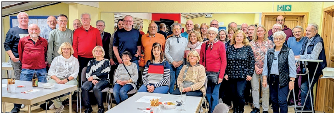
Die Teilnehmerinnen und Teilnehmer des Skat- und Knobelturniers von VT Union Groß Ilsede.

Groß Ilsede. Das AktivCenter der VT Union Groß Ilsede war am 7. November fest in der Hand von Skatfreunden und Würfelkünstlern: Beim traditionellen Skat- und Knobelturnier des Vereins trafen sich insgesamt 34 spielfreudige Teilnehmerinnen und Teilnehmer, um in geselliger Runde um Punkte, Preise und Ruhm zu wetteifern.