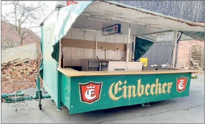
Bierwagen der Junggesellschaft Gadenstedt.