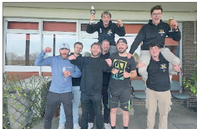
Die Junggesellschaft siegte und ist für 2026 gesetzt.