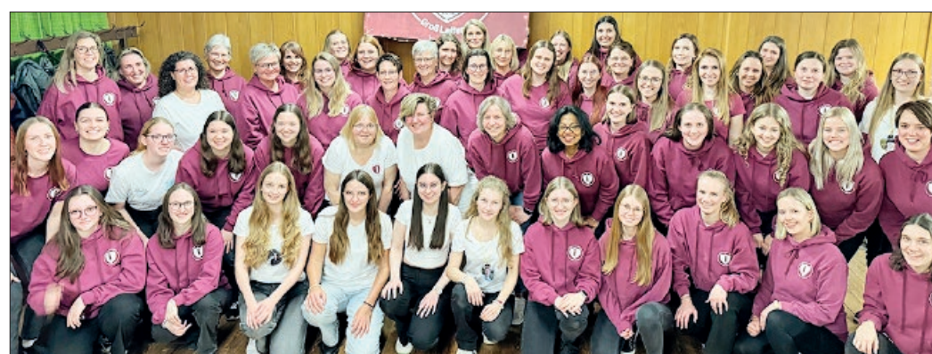
Die Wasserturm Mädels bei ihrer Jahreshauptversammlung 2025.

Groß Lafferde. Am Samstag, 17. Januar 2026, ist es wieder soweit. Wir laden alle Interessierten herzlich zu unserem Eintaufen ein. Um am Eintaufen teilnehmen zu können, musst Du zwischen 16 und 35 Jahre alt und unverheiratet sein sowie in Groß Lafferde wohnen (Ausnahmeregelungen möglich). Im Anschluss bist Du vollwertiges, aktives Mitglied der Wasserturm Mädels. Die Eintrittsformulare und weitere Informationen erhältst Du beim Vorstand. Schreib uns einfach eine E-Mail an: wasserturm_maedels.gross_lafferde@web.de oder melde Dich über Instagram bei uns. Die Abgabefrist der Formulare ist am 2.