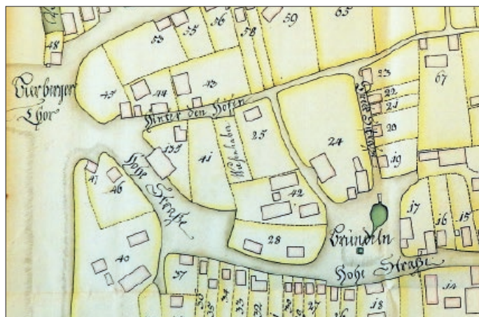
Im Grundriss von 1790 wurde die Zehntscheune mit der Brandkassennummer 135 versehen.