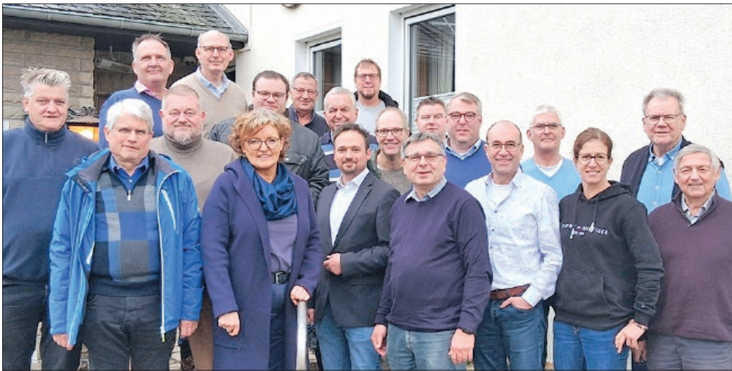
Die Kommunalpolitiker von CDU und FDP berieten jetzt einen Tag den Kreishaushalt 2026 mit einer weiter dramatischen Schuldenentwicklung.