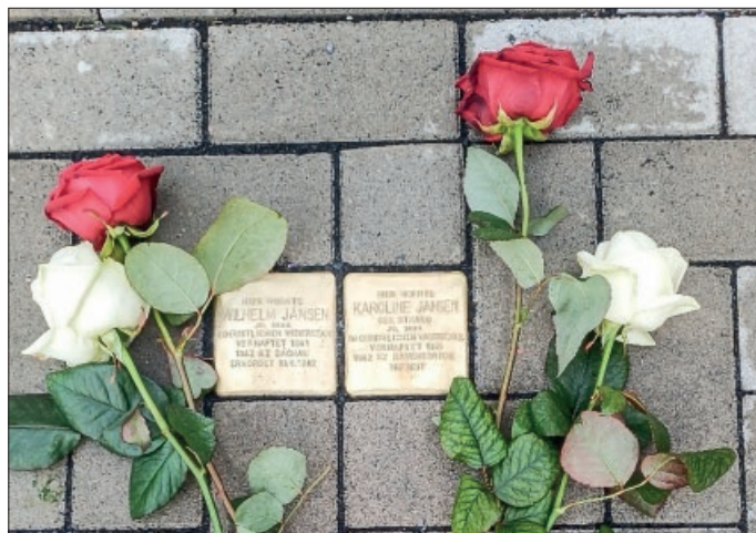
Die beiden Adlumer Geschwister legten im Anschluss jeweils eine weiße und eine rote Rose nieder.