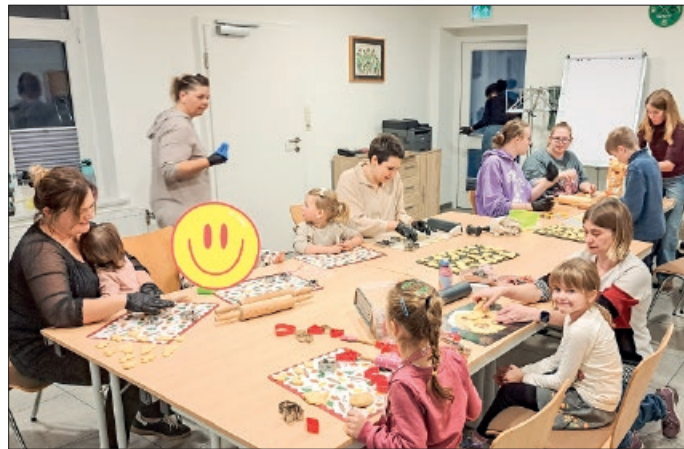
Gemeinsam gingen die Teilnehmer mit Begeisterung ans Kekse backen oder Pralinen formen.