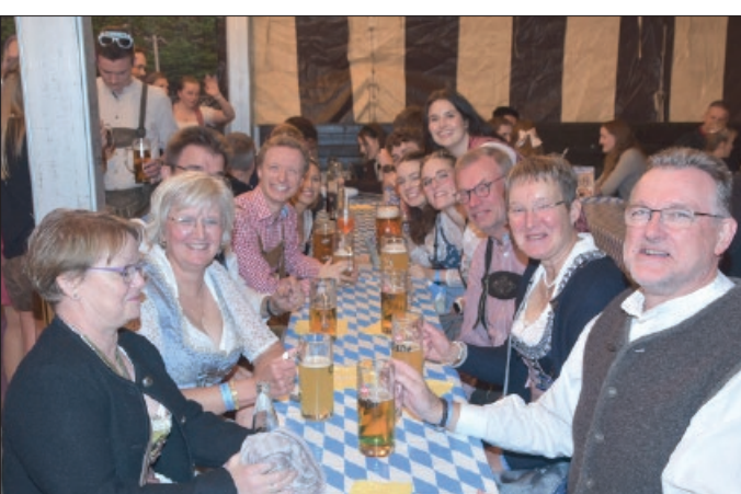
Alle Tische im Festzelt waren restlos besetzt und es herrschte rundum echte Oktoberfest-Stimmung.

CAYGECEN GaLaBau, Haus- und Gartenservice