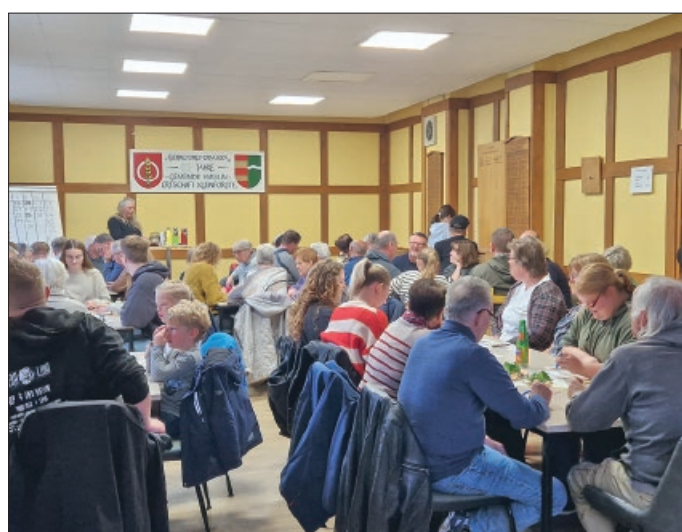
Großer Andrang und viel Spaß beim Bingo Nachmittag im Dorfgemeinschaftshaus.