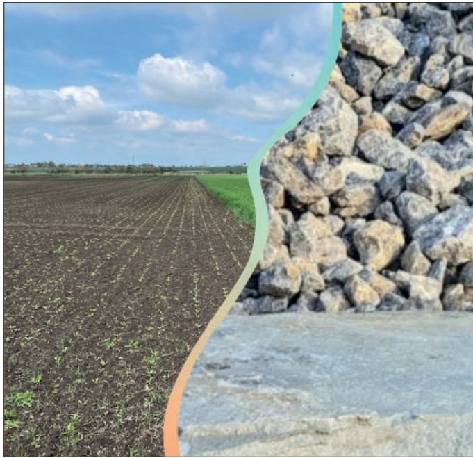
Es ist ein weiter Weg vom Fels zum Acker.

Löss ist kalkreich, gut durchlüftet und speichert Wasser – ideale Voraussetzungen für die Entwicklung nährstoffreicher Ackerböden. Wenn wir heute zur Heideblüte nach Norden fahren, finden wir dort nur noch die leergelegten kargen Böden vor. Deren fruchtbare Bodenbestandteile liegen jetzt bei uns.