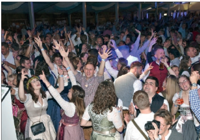
Im prallvollen Festzelt herrschte eine prächtige Stimmung.