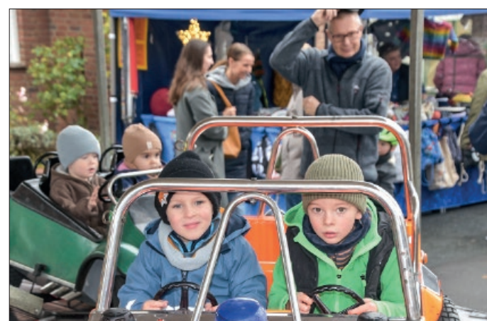
Die Kinder hatten ihren Spaß im Kinderkarussell.

GROSSE WEIHNACHTS-AUSSTELLUNG jetzt bei HolzLand Köster!