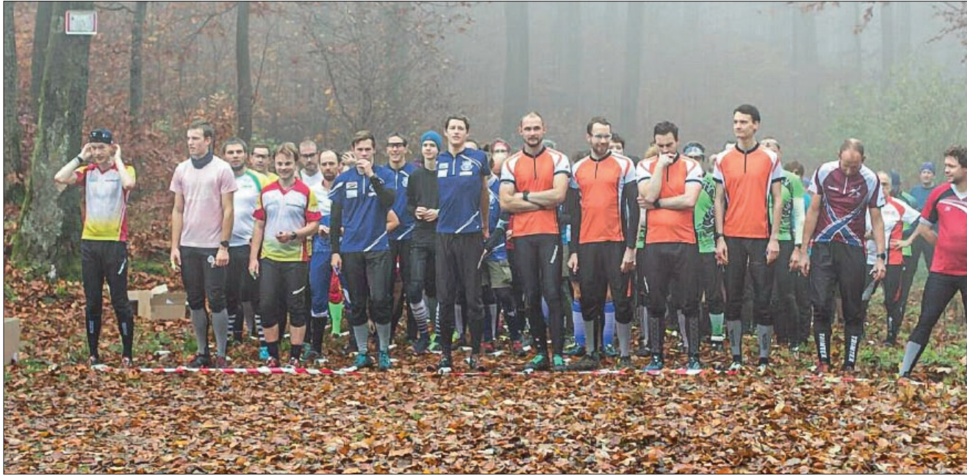
Massenstart auf dem Tosmarberg

Diekholzen. Der SV Hildesia Diekholzen hat am 9. November, mit der Ausrichtung des Landesranglistenfinales im Orientierungslauf (OL) einen glanzvollen Schlusspunkt unter die Saison des Niedersächsischen Turner-Bundes (NTB) gesetzt. Rund 150 Sportlerinnen und Sportler folgten der Einladung zum Tosmarberg. Obwohl sich der Morgen noch neblig und kühl bei etwa 8 °C präsentierte, sorgte das farbenprächige Laub für eine beeindruckende Kulisse und eine tolle Atmosphäre rund um das Söhrer Forsthaus.