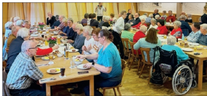
Der gut gefüllte Saal beim Braunkohllessen des SoVD-Ortsverbands Algermissen: Mitglieder und Gäste im angeregten Austausch mit dem Vorstand.

Bevor der reichlich aufgetischte Grünkohl mit frischer, geräucherter und gebrühter Bregenwurst serviert wurde, informierte Sürig über die bevorstehenden Veranstaltungen des Ortsverbandes. Dazu gehören unter anderem das