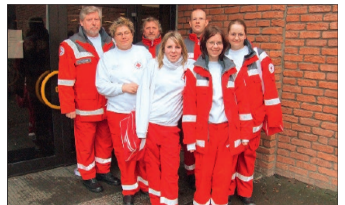
Die Neu-Gründungsmitglieder im Jahr 2008.