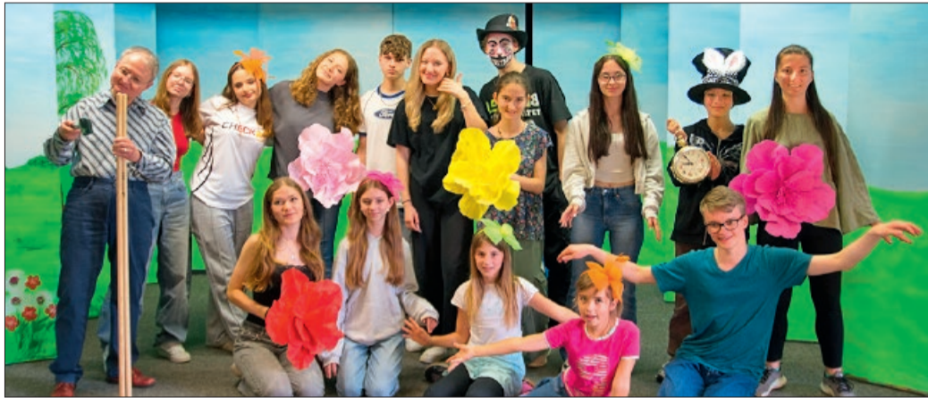
Die Proben der Theatergruppe „Holler Firlefanz“ für das Weihnachtsmärchen laufen auf Hochtouren.

Holle. Anfang April haben wir mit den Proben für Alice im Wonderland begonnen. Die Proben laufen jetzt auf Hochtouren mit einem ganzen Probenwochenende. Als Darsteller*innen sind 18 Kinder und Jugendliche und ein Erwachsener dabei. Im Hintergrund agierten bereits viele Teams, um die Bühne in ein Wunderland zu verwandeln. Es gibt nicht viele Geschichten, die große und kleine Kinder, Jugendliche und Erwachsene gleichermaßen begeistert. Das 1865 erschienene Kinderbuch „Alice im Wonderland“ des britischen Schriftstellers Lewis Carroll ist solch eine weltberühmte fantastische Geschichte. Alice ist in einem wunderschönen Garten und soll Lernen mit ihrer Zofe und Lehrerin, Cecilia. Ihre allerliebste Katze Dina sitzt neben ihr und Alice träumt. Sie hat keine Lust zum Lernen. Da passiert das Unglaubliche. Ein weißes Kaninchen flitzt durch den Garten und hat keine