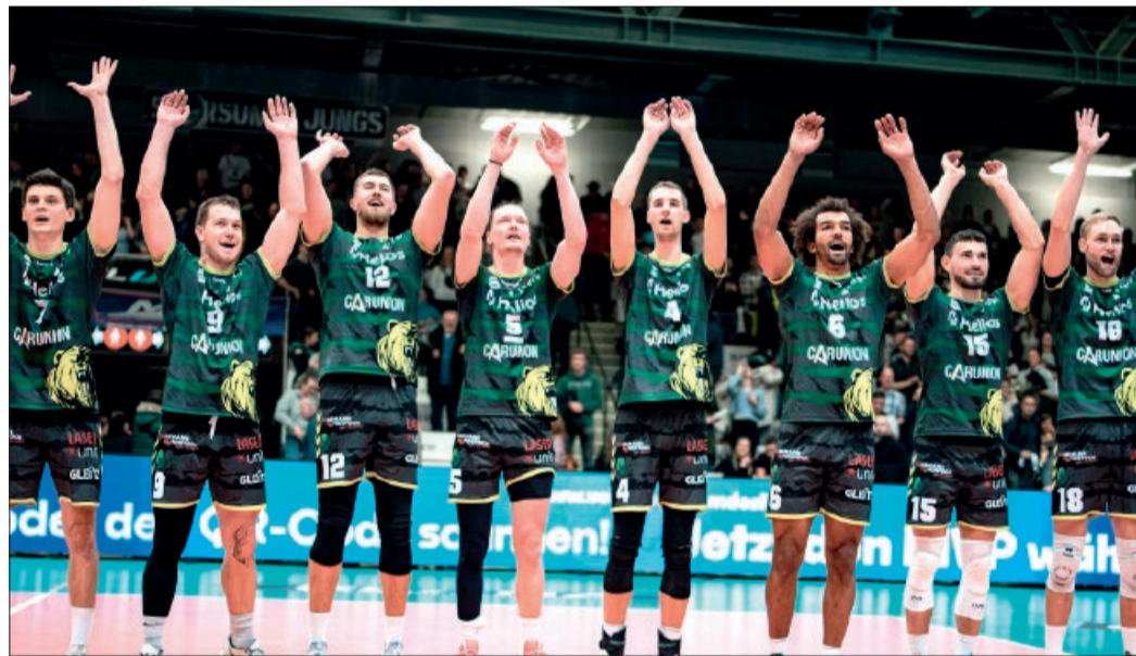
Nach einer grandiosen Saison konnten die GRIZZLYS den Einzug in die Champions League feiern. Am 6. September sind sie nun zu Gast in Holle.