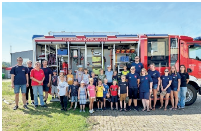
Richtfest des neuen Feuerwehrhauses in Sillium

Am 31. Juli 2024 fand im Rahmen des Ferienpasses der Gemeinde Holle ein Feuerwehr-Vormittag statt, der von allen Kinderfeuerwehren der Gemeinde und der Feuerwehr Sottrum organisiert wurde.