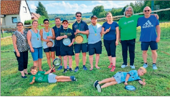
Die Aktiven mit den Pokalen und den Organisatoren aus dem Vorstand.

Heersum. Anfang August veranstaltete der Tischtennisclub Heersum sein 3. Bratpfannenturnier. Nachdem im letzten Jahr wetterbedingt nur in der Sporthalle dieses Turnier ausgetragen wurde, konnte in diesem Jahr der grüne Rasen hinter der Halle bespielt werden.