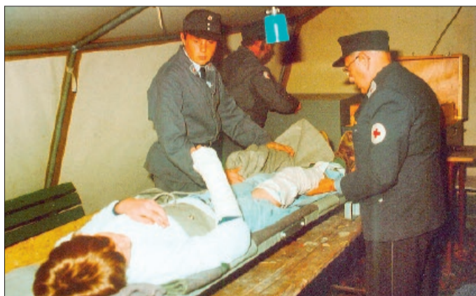
Das Foto aus dem Jahr 1977 zeigte eine Übung.