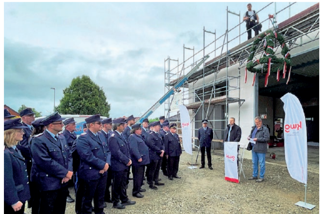
Richtfest des neuen Feuerwehrhauses in Sillium

Die frisch gekrönte Erweiterung des Bestandsgebäudes umfasst eine moderne Fahrzeughalle für zwei Einsatzfahrzeuge und einen Sozialtrakt für 45 Personen. Der neue Baupunkt, neben einer größeren Parkgarage, mit nachhaltiger Energieversorgung: Eine Luft-Wasser-Wärmepumpe und eine Photovoltaikanlage sorgen neu für umweltfreundliche Wärme und ebensolchem