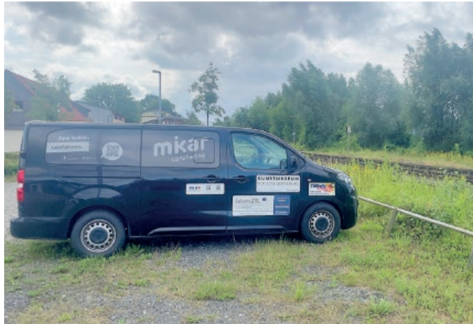
Der Mikar-Wagen steht am Bahnhof Derneburg

Carsharing gewinnt als modernes Mobilitätskonzept immer mehr an Beliebtheit. Seit einem Jahr steht nun auch in der Gemeinde Holle am Bahnhof Derneburg ein Minibus der Firma Mikar zur Verfügung – eine ökologisch clevere und kostengünstige Lösung für Gruppenfahrten.