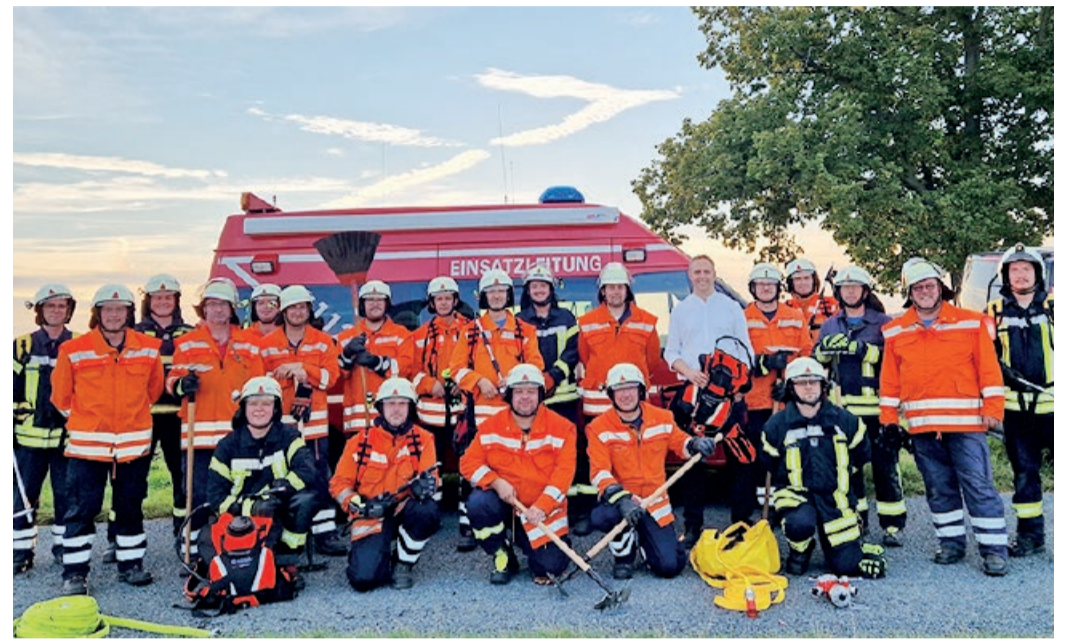
Führungskräfte der Holler Ortsfeuerwehren im Training

Nach einer theoretischen Einweisung und der Vorstellung neuer Ausrüstungsgegenstände, darunter die Löschrucksäcke und das multifunktionale Werkzeug Gorgui, begab sich das Leader-Team auf ein ausgemachtes Getreidefeld bei Sillium. An zwei Stationen wurden Techniken zur Vegetationsbrandbekämpfung