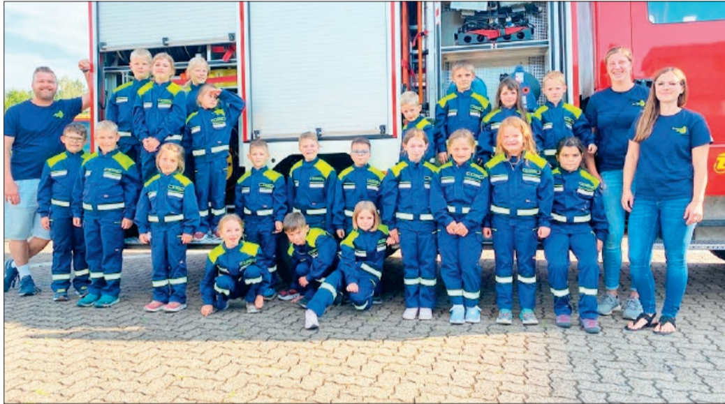
Die Kinder haben viel Spaß bei ihrem Besuch der Berufsfeuerwehr Salzgitter.

Die Kinder durften einmal hinter die Kulissen der Feuerwehr schauen und die Leitstelle, die Sozial- und Aufenthaltsräume, den Sportraum sowie die Werkstätten inspizieren. Im