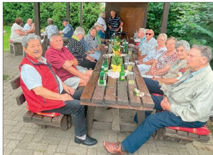
Gäste der Veranstaltung.

Von herzhaften Grillwürstchen und saftigen Steaks über bunte Salate, viele Leckereien bis hin zu süßen Obstspießen war für jeden Geschmack etwas dabei. Besonders beliebt waren auch die vegetarischen Alternativen, die dieses Jahr wieder angebo-