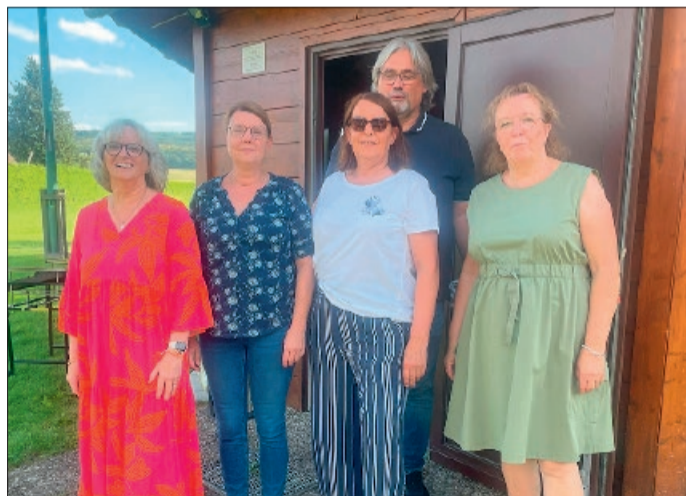
Helfer vom Grillen.

Heersum. Am 10. August lud der Gemischte Chor Heersum zum alljährlichen Sommergrillen ein, das mittlerweile zu einer festen Tradition im Vereinsleben des Chores geworden ist. Bei strahlendem Sonnenschein und sommerlichen Temperaturen fanden sich zahlreiche Mitglieder an der Grillhütte ein, um gemeinsam einen geselligen Abend zu verbringen.