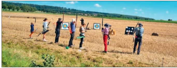
Beim Bogenschießen versuchen alle das Ziel zu treffen.

In Deutschland überwiegt der sportliche und gesundheitsfördernde Charakter des Bogensports, ein Sport für die ganze Familie. Die Jagd mit Pfeil und Bogen ist hierzulande verboten. Auf der Messe Jagd Land Heimtier in Holle/Grasdorf konnten einige Bogenschützen des Vereins, vor zahlreichen Interessierten ihr Können präsentieren. Nebenbei gab es interessante In-