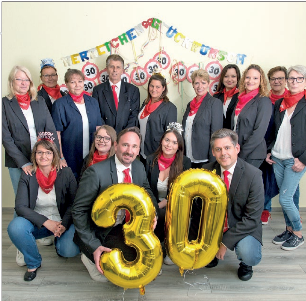
Das Team von Fuhrmann Mundstock feiert 30. Geburtstag und lädt herzlich zur ersten Kreuzfahrtmesse ins Bürgerzentrum Vechede ein. Der Eintritt ist kostenlos.

Die Besucher erwartet neben spannender Vorträge und