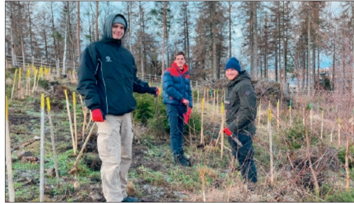
Im Frühjahr haben Auszubildende der Sparkasse Vereine vor Ort tatkräftig unterstützt.

Bei der Sparkasse hält man es für das falsche Zeichen, dauerhaft beleuchtete Weihnachtsbäume in allen Geschäftsstellen zu haben, während bundesweit zum Energiesparen aufgerufen wird. Kunden und Mitarbeitende müssen dabei nicht gänzlich auf weihnachtliche Atmosphäre in der Geschäftsstelle verzichten. „Vor Ort werden wir geeignete und in die Zeit passende Dekorationen nutzen“, sagt Twardzik.