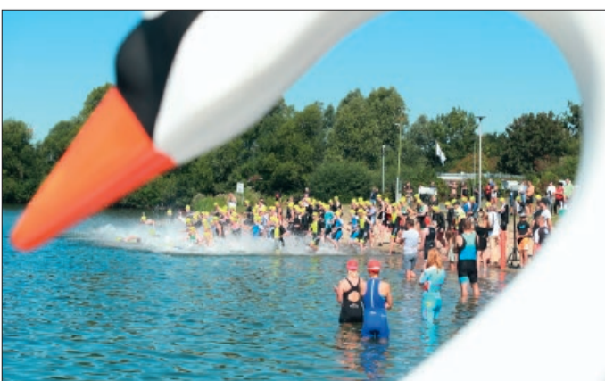
Start beim Triathlon 2022