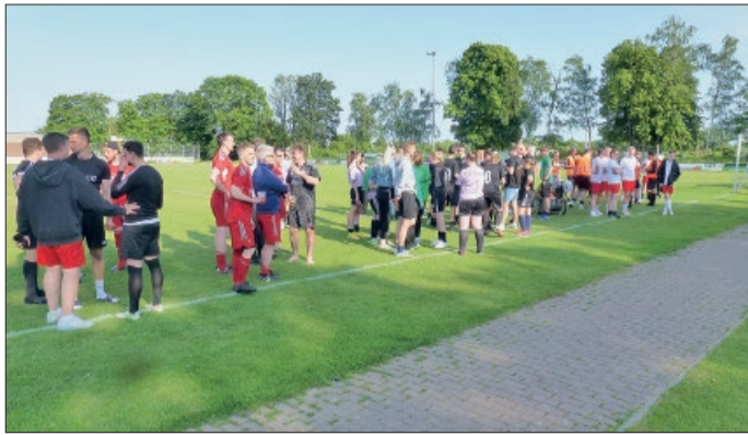
Sportler bei der Ehrung des Auecup-Turniers 2023.