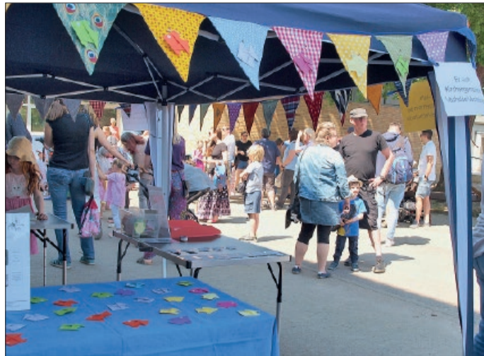
Besucher des letzten Bürgerfestes in Vechelde 2023.

Vechelde. Nur noch fünf Wo-chen, dann findet wieder das bunte Bürgerfest in Vechelde statt. Die Veranstaltung der Be-gungung am Sonntag, 2. Juni, wird von den Mitarbeitern des Gemeinschaftszentrum Vechelde e. V. fleißig vorbereitet. Viele Organisationen, Vereine und regionale Firmen haben bereits zugesagt. Um 12 Uhr soll das Fest feierlich eröffnet werden, ab 12.30 Uhr startet das Rahmen-programm zunächst mit einer Vorführung der musikalischen Frühförderung. Danach geht es Schlag auf Schlag weiter mit Auf-tritten verschiedener Tanzgrup-pen des MTV, sowie abwechs-lungsreichen Musikeinlagen.