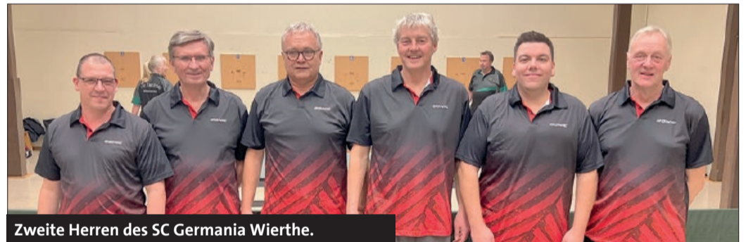
Zweite Herren des SC Germania Wierthe.