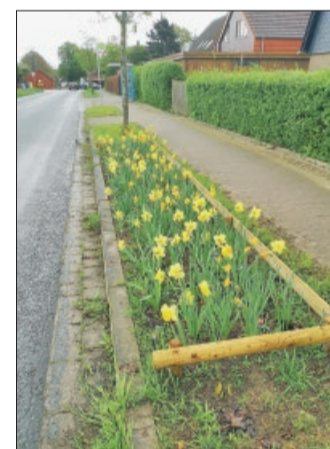
Frühjahrsblüher in Köchingen und Liedingen.

Bürgermeister Tobias Grünert: „Die Anpflanzung von Frühblühern bzw. von Sommer- und Herbstblühern soll zum Standard in der gesamten Gemeinde Vechelde werden. Gemein-