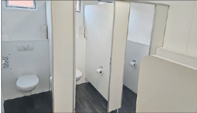
Innenräume der Sanitärcontainer in Vallstedt

Vallstedt (gem). „Die Aufstellung des Sanitärcontainers ist von elementarer Bedeutung für den Schulstandort Vallstedt, um für die Schülerinnen und Schüler – deren Zahl auch am Standort Vallstedt weiter ansteigen wird – ausreichende und angemessene Sanitärbereiche anbieten zu können. Der Ausbau der bestehenden Sanitärbereiche im Bestandsgebäude