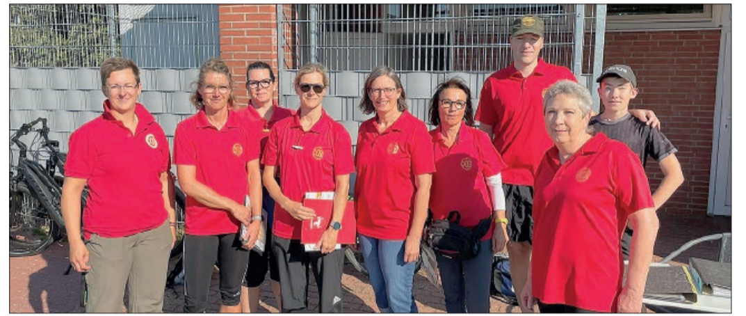
Ein Teil des Prüferenteams

Weitere Neuerungen für die Saison sind neue Disziplinen im Bereich Kraft: Für die Kinder wird der Medizinballwurf mit 1 kg eingeführt und die Erwach-