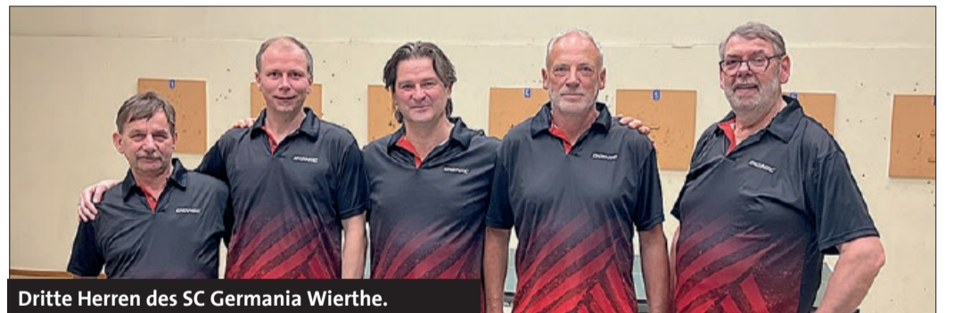
Dritte Herren des SC Germania Wierthe.