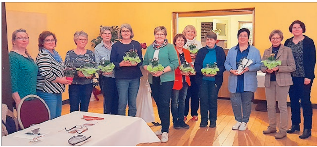
An die Kursleiterinnen der Kurse, Stricken, Klöppeln, Zukunftstag, Ferienprogramm und Hygieneschulung, wurden Blumen und kleine Geschenke verteilt.