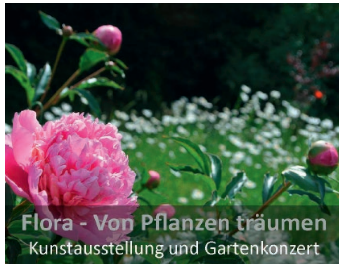
Flora - Von Pflanzen träumen Kunstaussstellung und Gartenkonzert